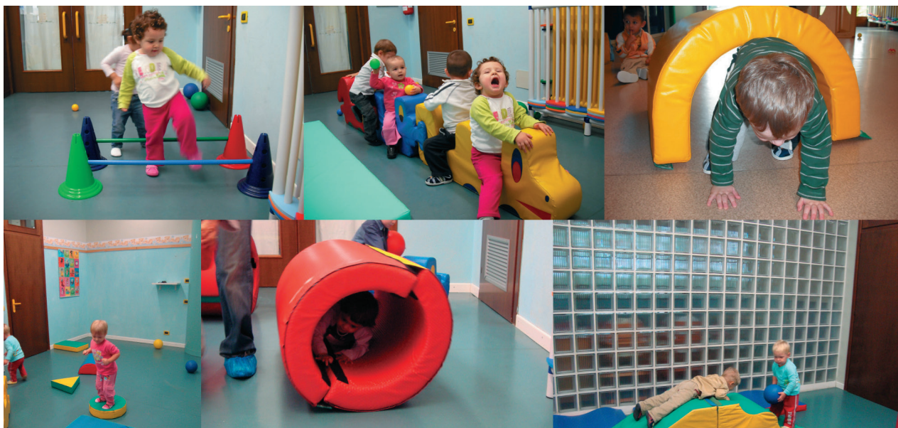
Giochi di posizionamento nello spazio

Il laboratorio "Il corpo intelligente" mette in relazione le azioni concrete e simboliche dei bambini per finalizzarle a scopi da raggiungere. L'agire, infatti, è un modo per attingere, da noi e dall'ambiente, informazioni utili per comprendere il nostro funzionamento e quello del mondo (agire per apprendere).