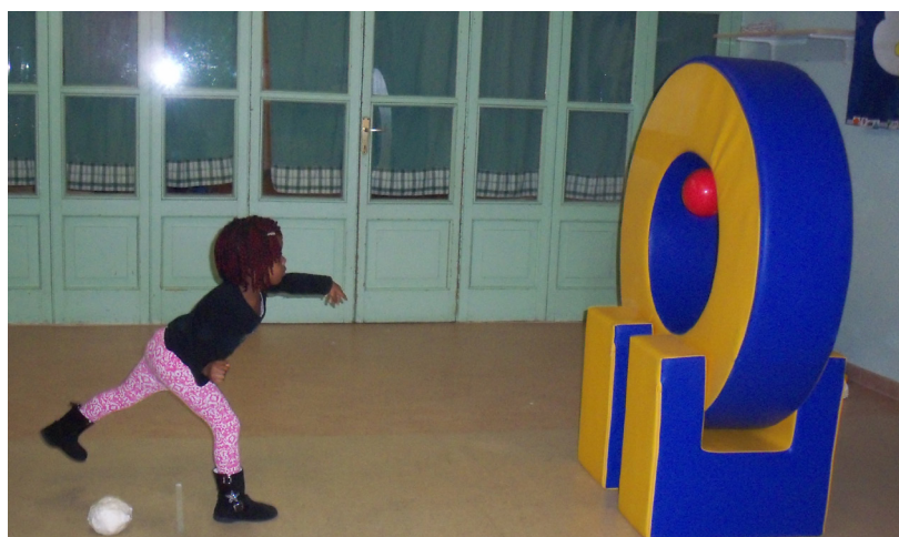
Giochi di mire funzionali