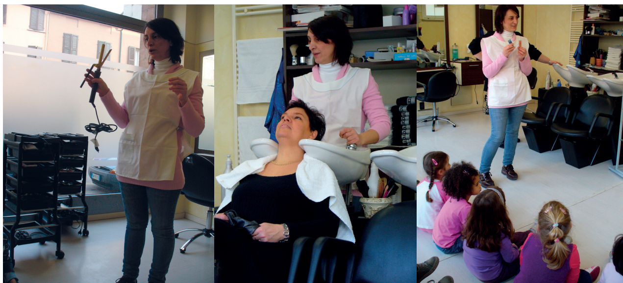
Visite alle attività di quartiere

La maggior parte delle scuole valorizzano il quartiere con visite ai negozi e progetti ad hoc in collaborazione con vari professionisti: fioristi, fruttivendoli, pasticceri, venditori ubicati in quartiere e raggiungibili comodamente dai bambini. Accompagnano, inoltre, i bambini a conoscere la città, con i suoi luoghi e le sue tradizioni, e il territorio.