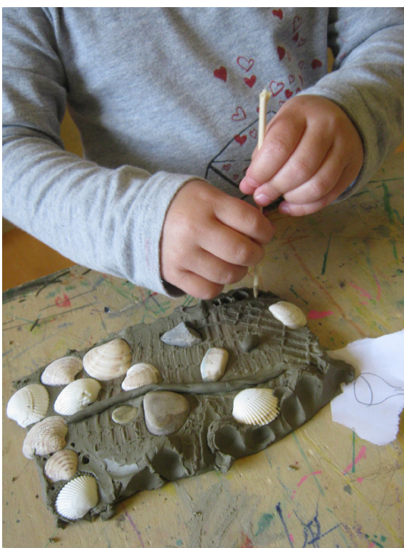
Tecniche di composizione con la creta