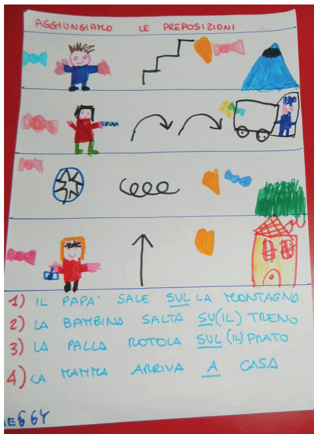
Composizione di frasi con immagini del soggetto, del predicato verbale e di altri complementi