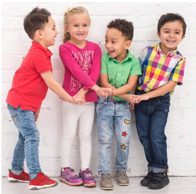
Giochi di gruppo all'aperto

Anche i piccolissimi oggi vivono esperienze diverse: la società si fa più complessa e la scuola, nella promozione della cittadinanza, accoglie una molteplicità di culture e di lingue attraverso laboratori interculturali che aiutano a rimuovere ostacoli linguistici, culturali e sociali .