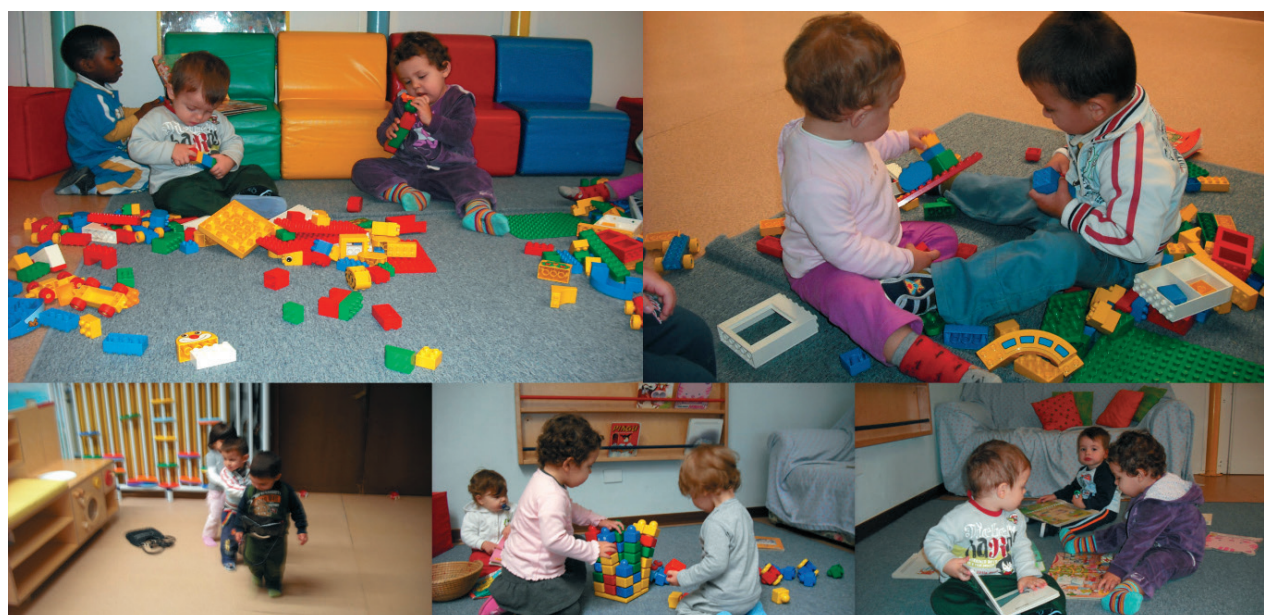
Sollecitazione di funzionalità spaziali, temporali e logiche