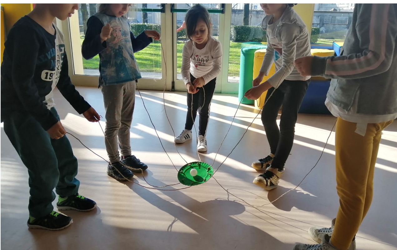
Giochi per sollecitare conoscenze in ambito logico - matematico (approccio STEM)