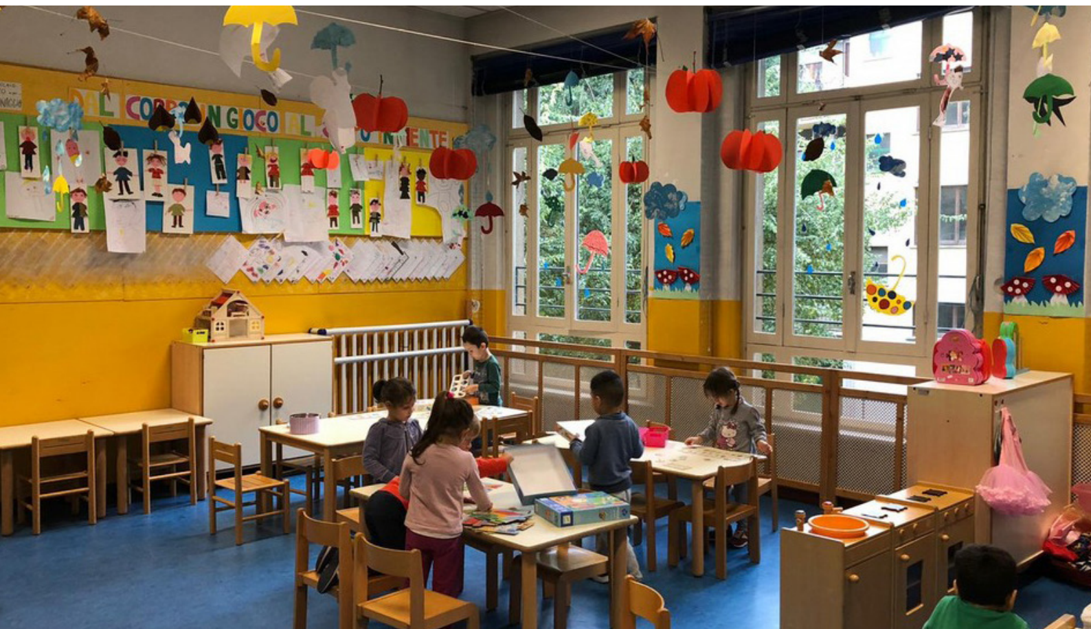
Attività logico-matematiche in sezione