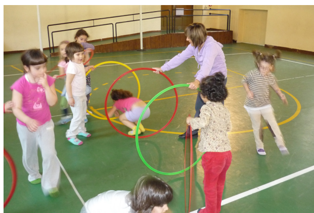
Giochi pededeutici alla spazialità