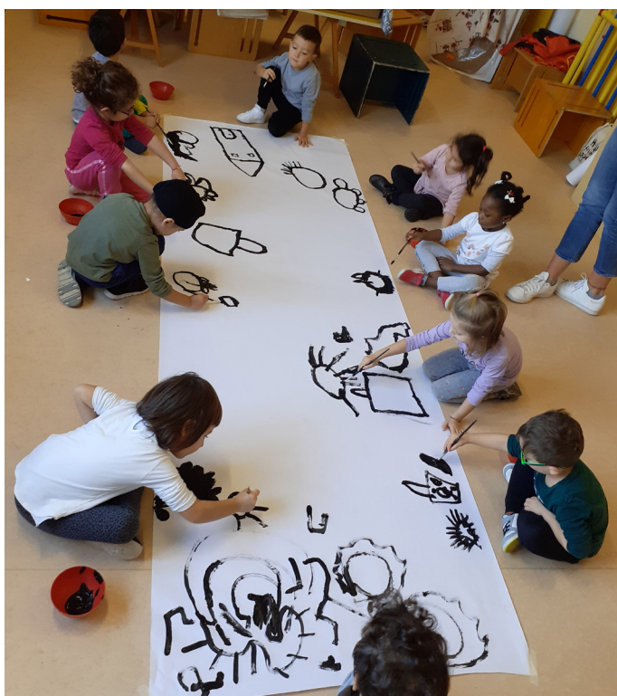
Evoluzione del segno grafico