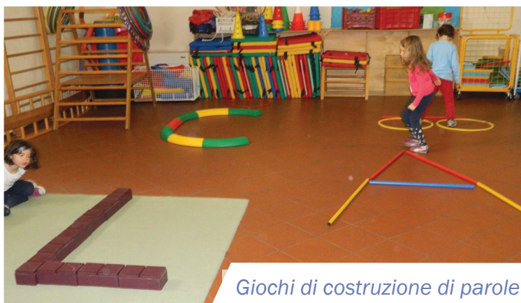
Giochi di costruzione di parole