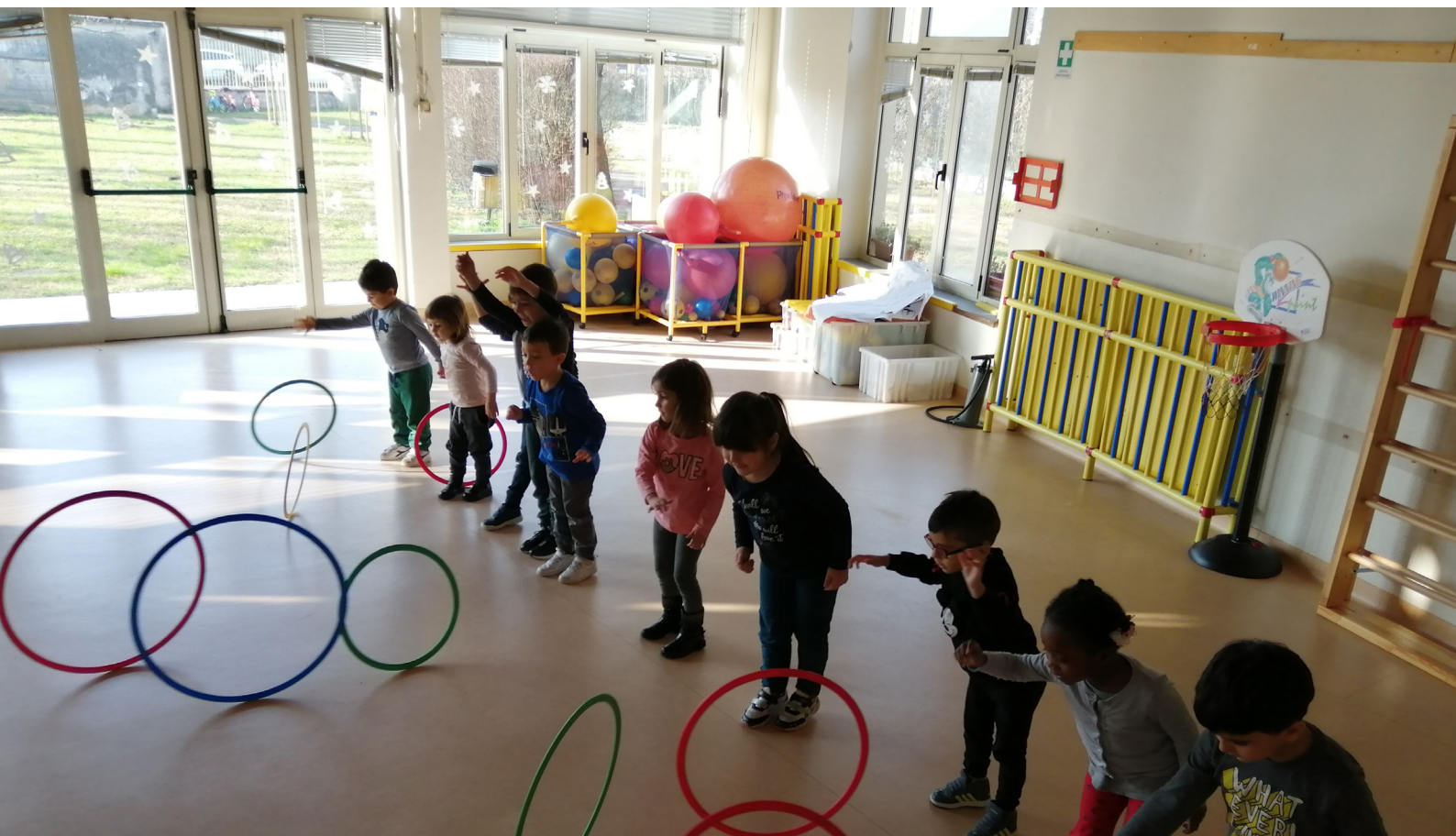
Attività nello spazio dedicato all'attività motoria