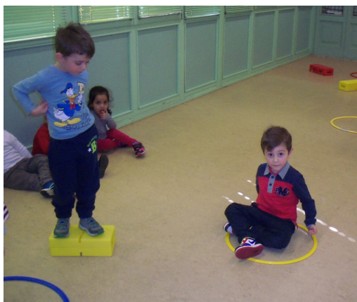
Giochi di posizionamento nello spazio

Questo approccio consente ai bambini di entrare naturalmente nel mondo della matematica e di potenziare le proprie capacità logico-matematiche.