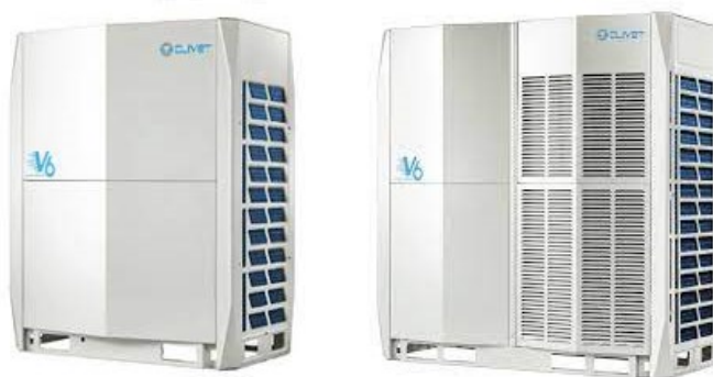
Fig. 1 - impianto MV6i - XMI 400T ed a destra impianto MV6i - XMI 670T

1.830 x 1.730 x 850 mm. (CLIVET modello MV6i - XMI 670T)