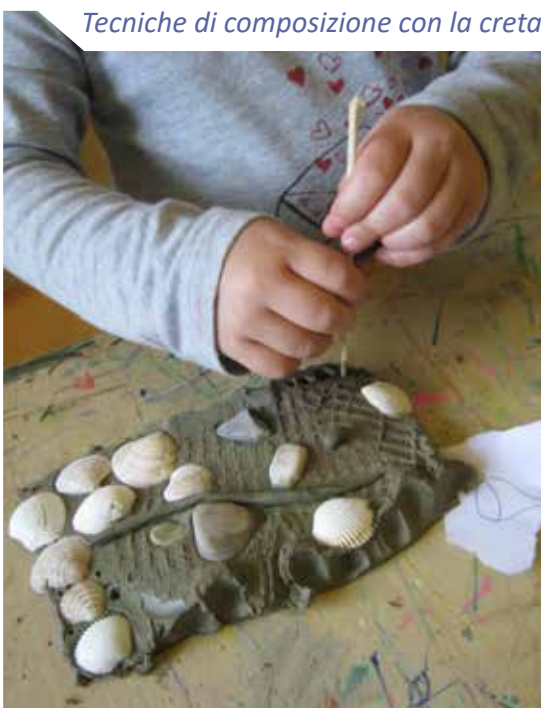
Tecniche di composizione con la creta