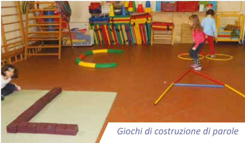
Giochi di costruzione di parole