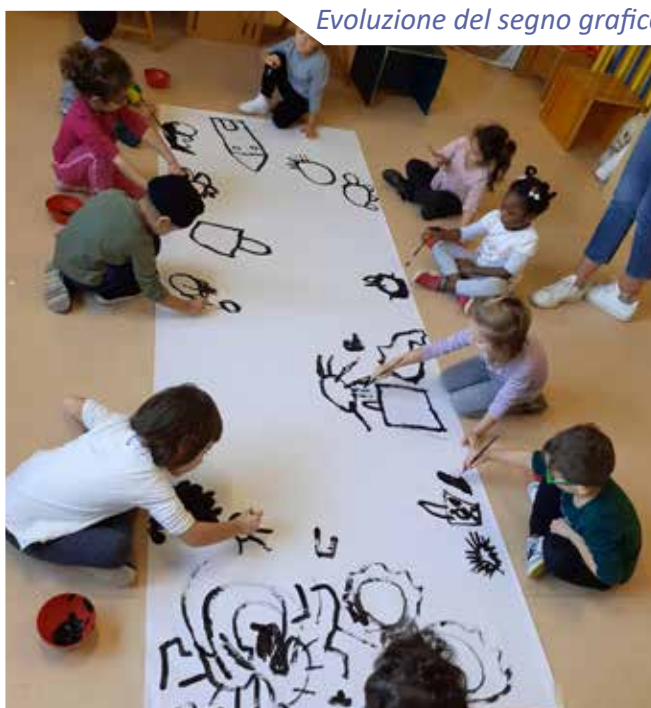
Evoluzione del segno grafico