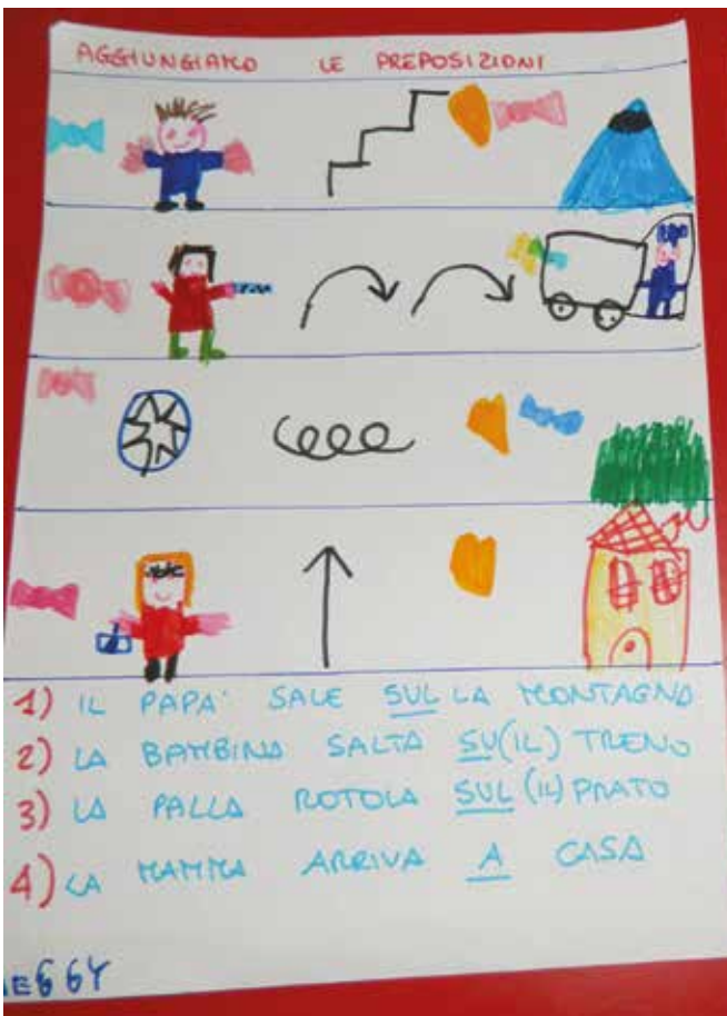
Composizione di frasi con immagini del soggetto, del predicato verbale e di altri complementi