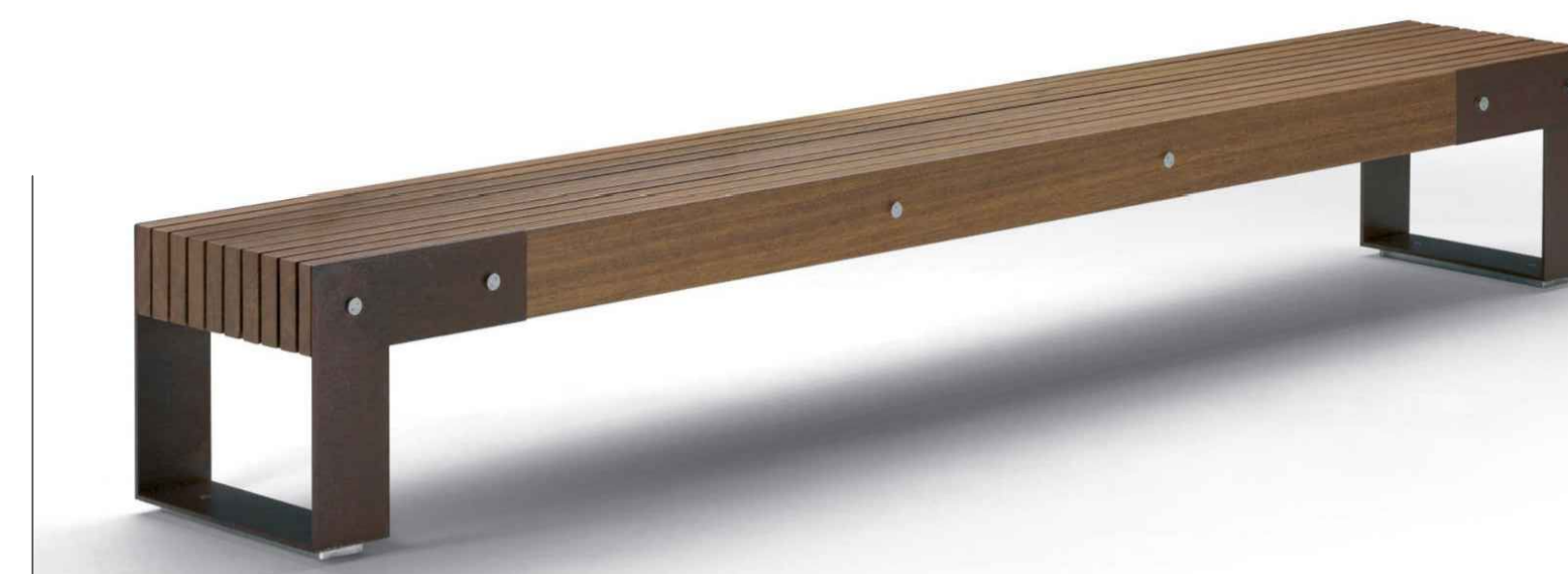
IDEAS L | Panchina