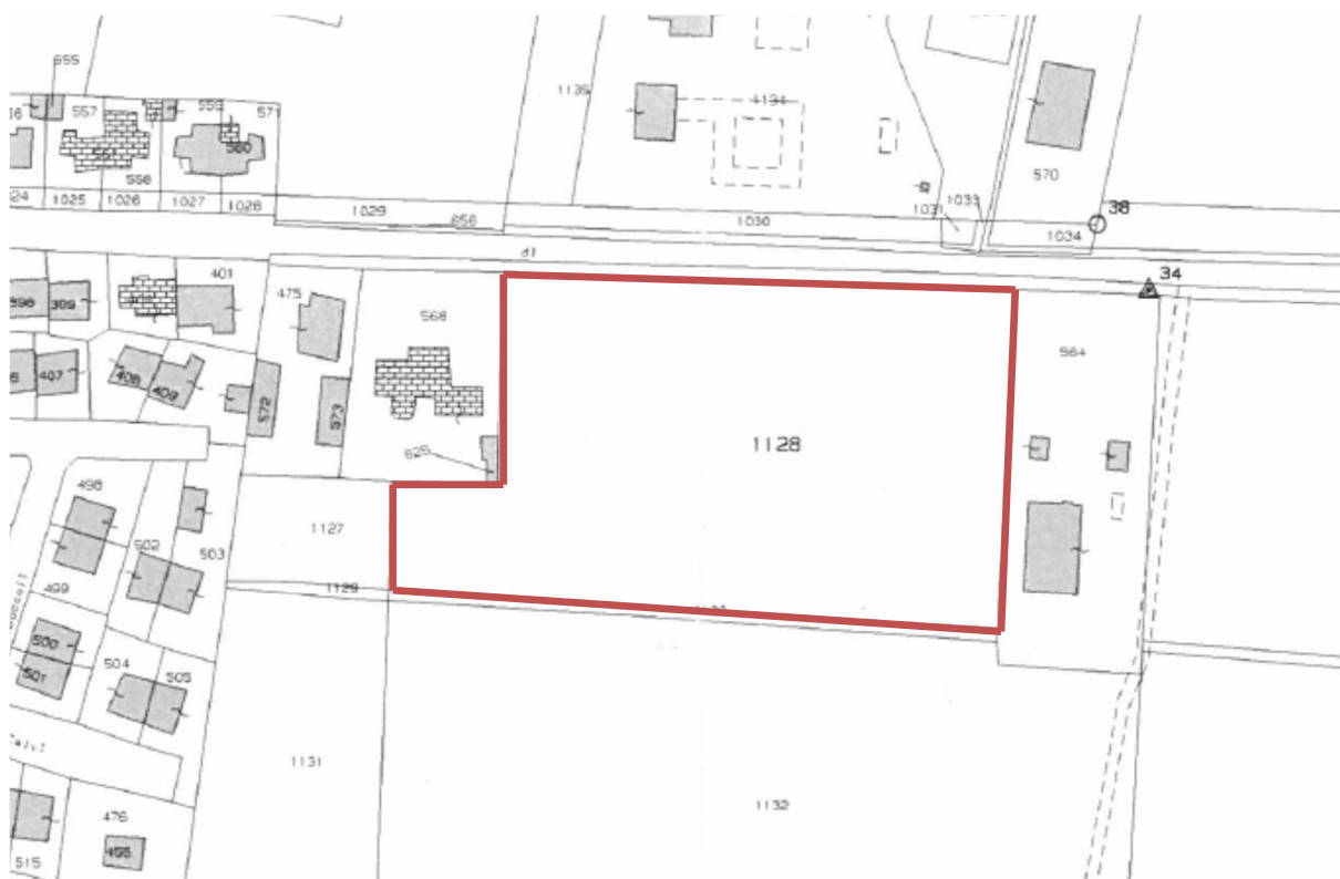
estratto di mappa comune di cremona fg 53