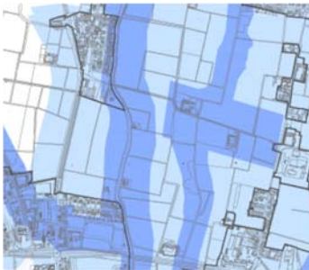
PGRA aree tra centro città e il Boschetto, Naviglio e Fregalino