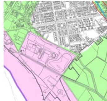
Proposta di modifica dell'area a rischio allagamento Parco Po