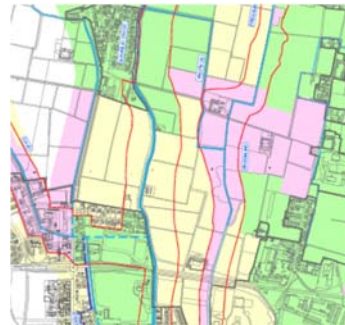
Proposta di modifica dell'area a rischio allagamento aree tra centro città e il Boschetto, Naviglio e Fregalino