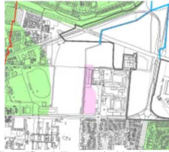
Proposta di modifica dell'area a rischio allagamento zona via Maffi e via Postumia