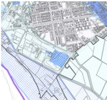
PGRA area del Parco Po