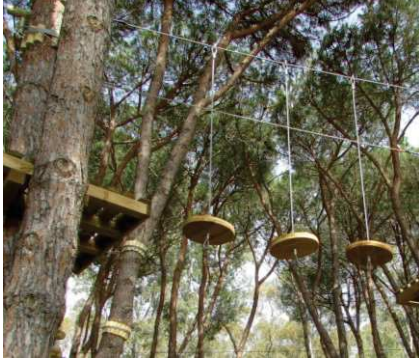
ELEMENTO PIATTELLI APPESI (consigliato Percorso ROSSO)