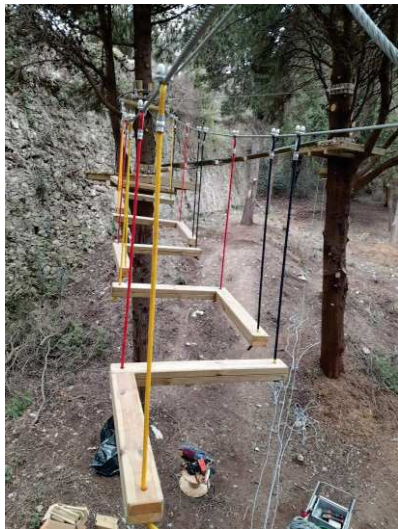
PASSERELLA L (consigliato percorso Blu o Rosso)