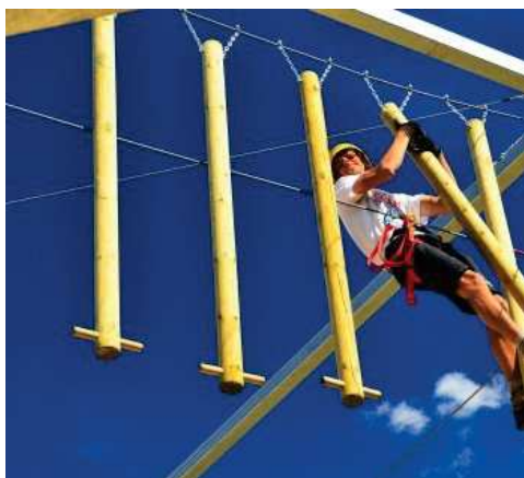
BASTONI APPESI (consigliato percorso Rosso)