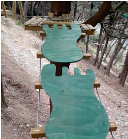
ELEMENTO PIEDONI (consigliato Percorso Verde)

Questi elementi di arredo sono alcune delle nostre proposte per il vostro parco avventura, l'elenco definitivo sarà sottoposto alla vostra approvazione