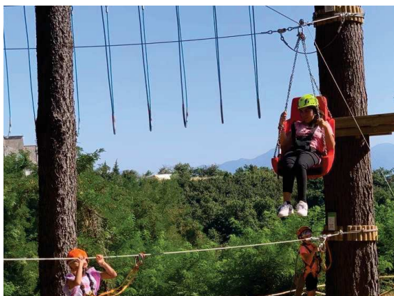
TELEFERICA INCLUSIVA (consigliato Percorso ZIP-LINE)