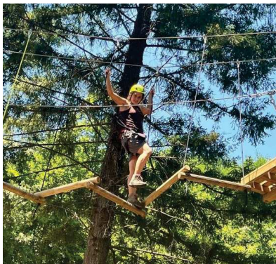
ALTALENE TRASVERSALI (consigliato Percorso Rosso)