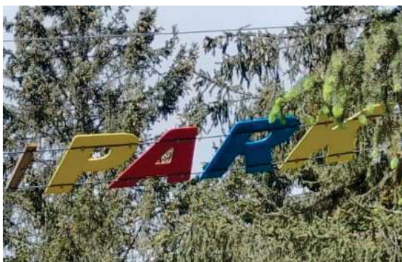
PASSERELLA LETTERE (consigliato Percorso ROSSO da installare nel percorso più vicino all'entrata parco)