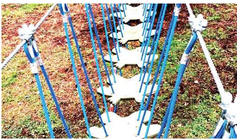
PASSERELLA RANE (consigliato Percorso Verde)