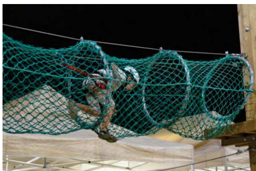
TUNNEL DI RETE (consigliato Percorso Verde o Blu)