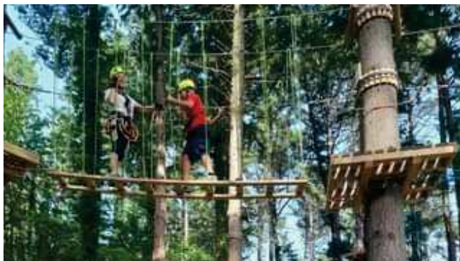
PASSERELLA ELASTICA (consigliato percorso Blu)