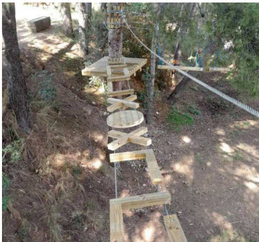
PASSERELLA IBRIDA (consigliato percorso Blu o Verde)