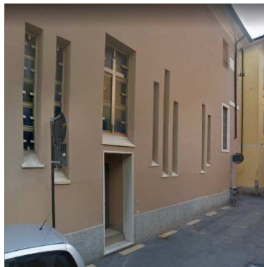
53. CAPPELLA C/O CASA DI CURA ANCELLE DELLA CARITA'