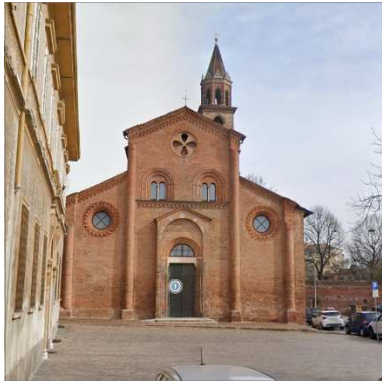
13. CHIESA SAN MICHELE