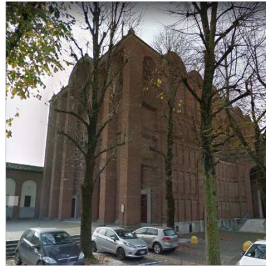
26. CHIESA SANT'AMBROGIO