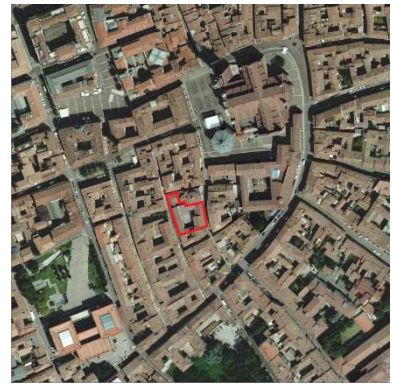
66. ORATORIO SANTA MARIA ASSUNTA (CATTEDRALE)