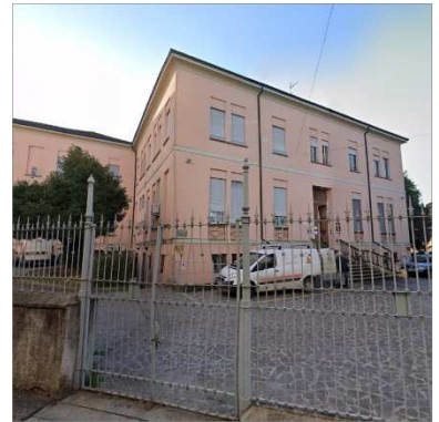
97. CENTRO DIOCESANO