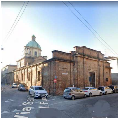
98. EX CHIESA SAN FACIO