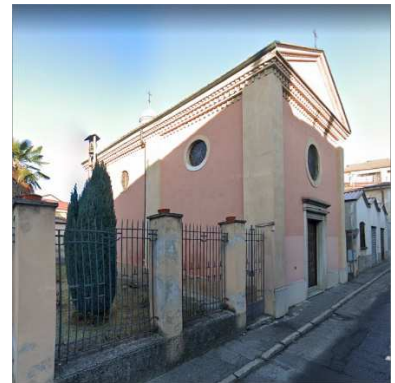
30. CHIESA I MORTINI