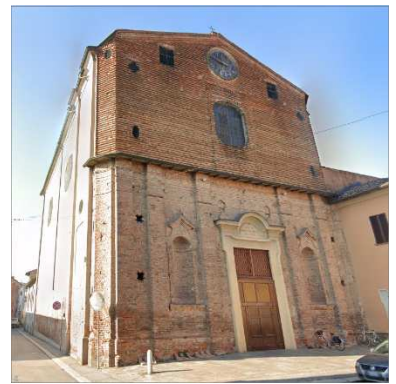
21. CHIESA SANT'ILARIO