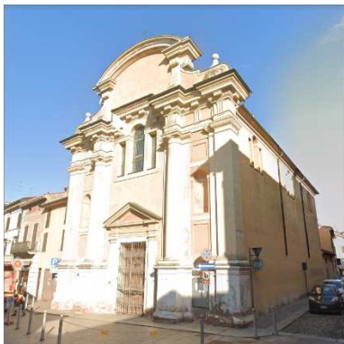
16. CHIESA S. SIRO E S. SEPOLCRO