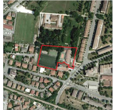
69. ORATORIO SAN FRANCESCO D'ASSISI