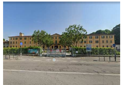
103. SEMINARIO VESCOVILE