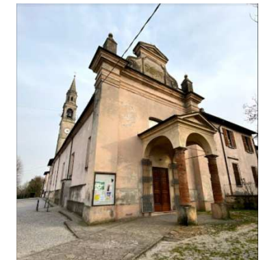
47. CHIESA SANTA MARIA MADDALENA (ABBADIA)