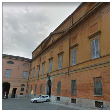
102. CURIA VESCOVILE