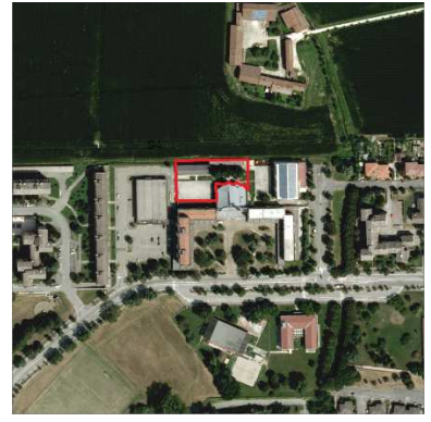
94. ORATORIO SAN GIUSEPPE