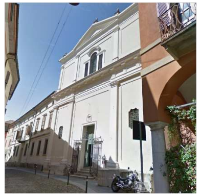
9. CHIESA SAN GIROLAMO