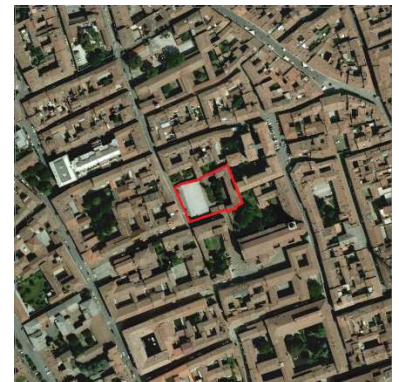
90. ORATORIO SANT'AGOSTINO