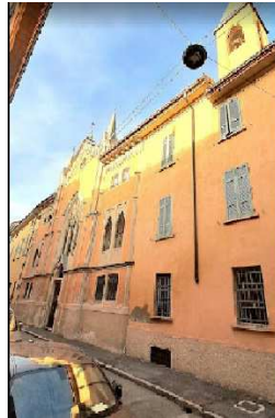
50. CHIESA BUON PASTORE