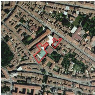
86./87. ORATORIO E ABITAZIONE SANT'IMERIO