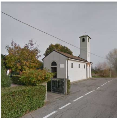
43. CHIESA SANTA CRISTINA