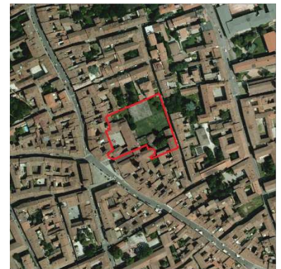
81. ORATORIO SANT'AGATA