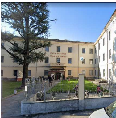
58. CAPPELLA C/O CASA DI CURA FIGLIE DI SAN CAMILLO