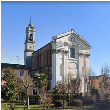
46. CHIESA SAN BARTOLOMEO APOSTOLO (PICENENGO)