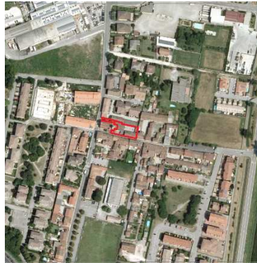
76. ORATORIO SAN FELICE