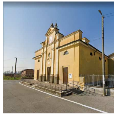
44. CHIESA SAN SAVINO