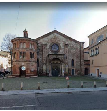
11. CHIESA SAN LUCA