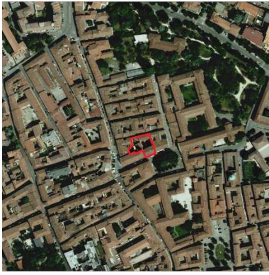
91. ORATORIO SAN SIRO (S.ABBONDIO)