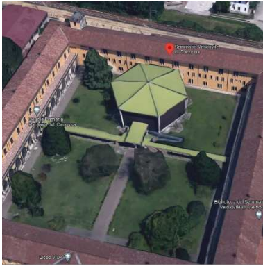
37. CHIESA DEL SEMINARIO