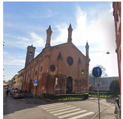
18. CHIESA SANTA MARIA MADDALENA