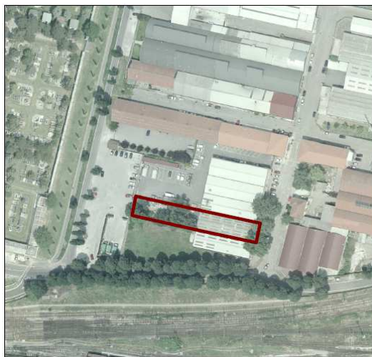
istanza n. 10.0 - Centro Culturale Islamico Cremonese “La Speranza” - via San Bernardo

- La prima istanza (allora identificata con il n. 10.0 ) riguarda l'immobile che attualmente è sede del Centro Culturale Islamico Cremonese “La Speranza”: l'edificio ha una superficie coperta di circa 500 mq ed altrettanta area scoperta, in un contesto che vede la presenza di attività artigianali, commerciali e produttive, a sud del quartiere Borgo Loreto. L'associazione chiede il riconoscimento come “SR - Servizi Religiosi”.