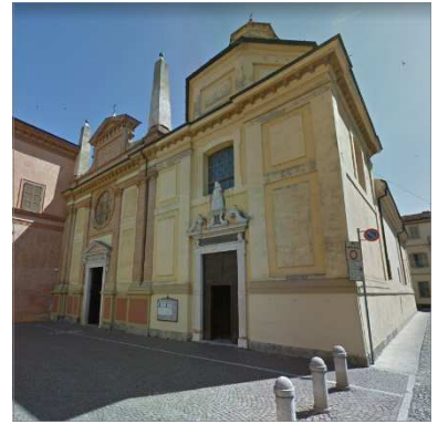
15. CHIESA SANT'ABBONDIO