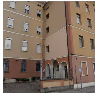
54. CAPPELLA C/O CASA DI CURA CAMILLIANI