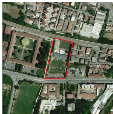
83. ORATORIO SANT'A.M.ZACCARIA