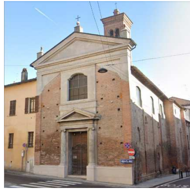
14. CHIESA SAN GREGORIO