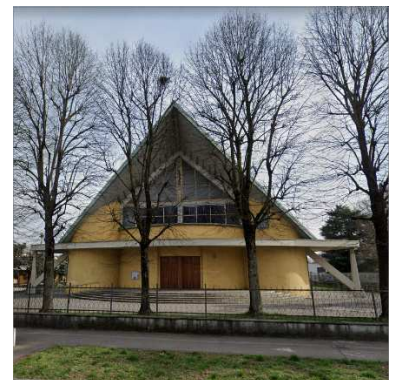
33. CHIESA BEATA VERGINE DI CARAVAGGIO