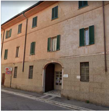
61. CAPPELLA C/O CASA SAN GIUSEPPE (CARMELITANE)