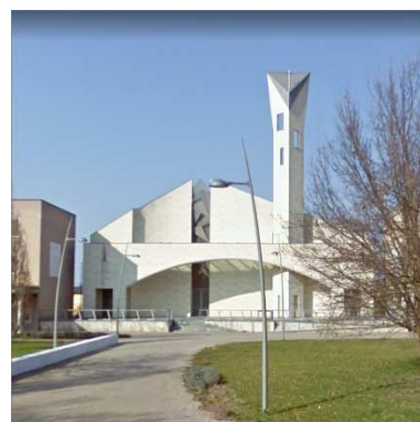
35. CHIESA SAN GIUSEPPE