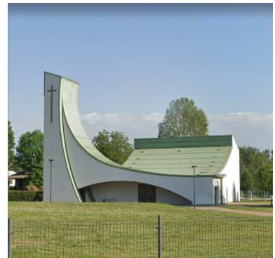
42. CHIESA IMMACOLATA CONCEZIONE