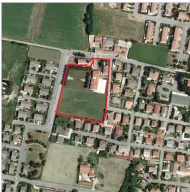
70. ORATORIO SANTA MARIA ANNUNCIATA