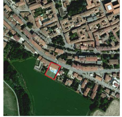
106. ORATORIO SAN PIETRO (RESIDENZA)