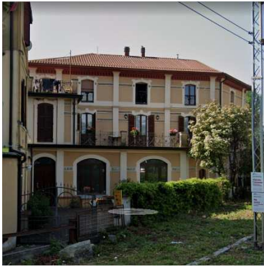
1. CHIESA CRISTIANA AVVENTISTA DEL SETTIMO GIORNO