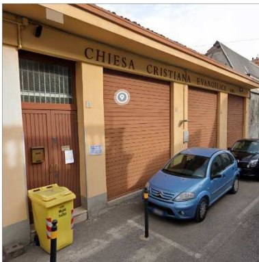
4. CHIESA CRISTIANA EVANGELICA - ADI