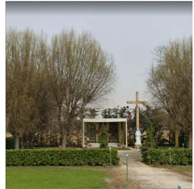
51. CAPPELLA DEL SANTO VOLTO