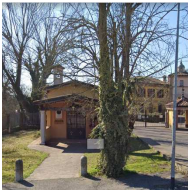
52. CAPPELLA SAN ROCCO