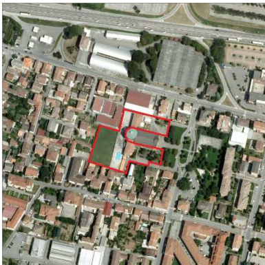
64. ORATORIO BEATA VERGINE LAURETANA