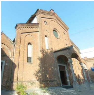
28. CHIESA E CONVENTO SAN GIUSEPPE (CAPPUCCINI)