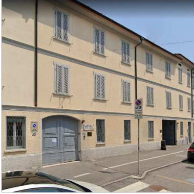
104. SUORE DELLA PROVVIDENZA PER INFANZIA ABBANDONATA (RESIDENZA)