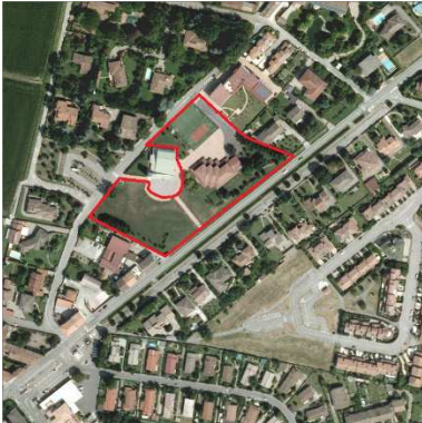
67. ORATORIO IMMACOLATA CONCEZIONE