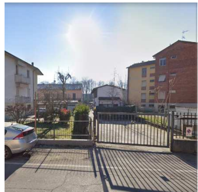
57. ASSEMBLEE DI DIO DELLA COMUNITA' AFRICANA IN ITALIA