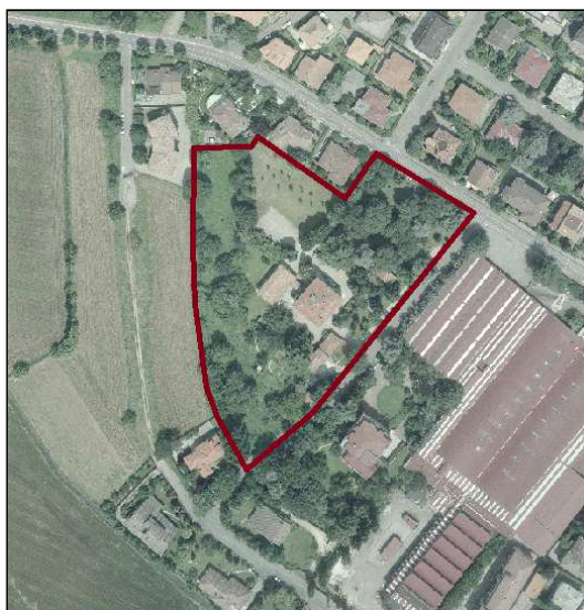
istanza n. 7.0 – Società di Mutuo Soccorso fra i sacerdoti della Diocesi di Cremona - via Flaminia

Ciò consentirebbe alla Società di affittare i dodici mini appartamenti presenti, traendone così un reddito da destinare ai servizi del clero ammalato o inabile. Parte dell'area a parco è stata già alienata.