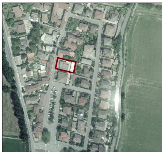
istanza n. 44.0 – Parrocchia S.Maria Nascente (ex Oratorio) – Migliaro

comportanti un importante impegno economico. Il lotto ha un'estensione di circa 850 mq dei quali 250 coperti ed è inserito in un contesto interamente residenziale.