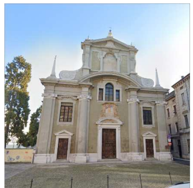
12. CHIESA SAN VINCENZO