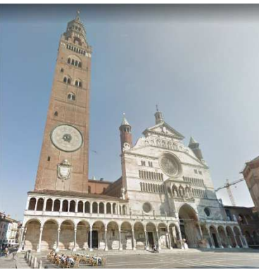
8. DIOCESI DI CREMONA – CATTEDRALE S.MARIA ASSUNTA