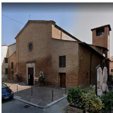
22. CHIESA SAN BASSIANO