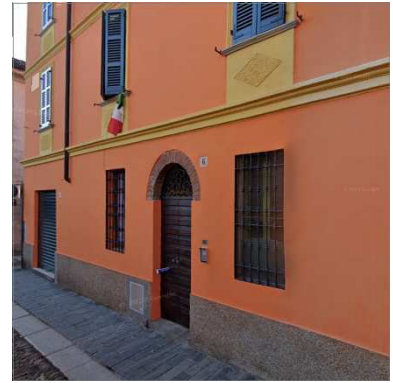
3. CHIESA CRISTIANA EVANGELICA DEI FRATELLI