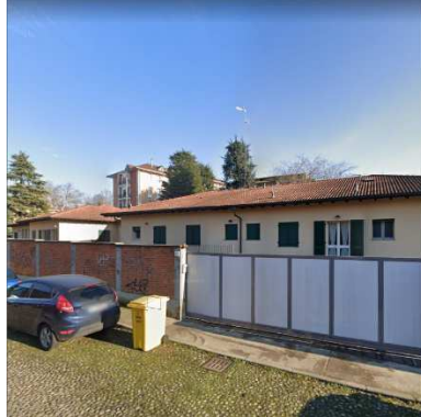
105. SUORE ADORATRICI DEL SANTISSIMO SACRAMENTO (RESIDENZA)