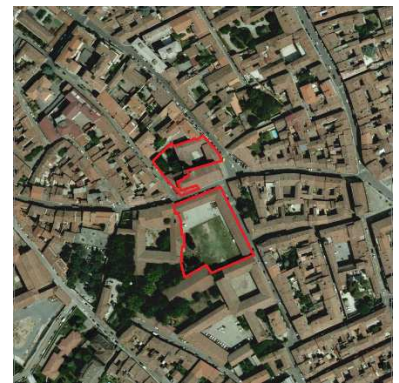
84./85. ORATORIO SANT'ILARIO