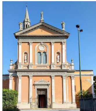
29. CHIESA SAN SEBASTIANO