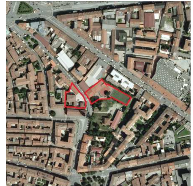
77./78. ORATORIO SAN MICHELE