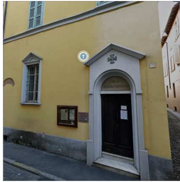
2. CHIESA EVANGELICA METODISTA