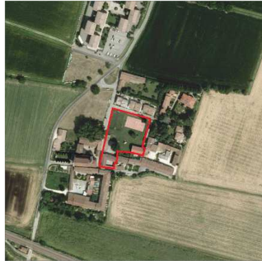
68. ORATORIO SAN BARTOLOMEO APOSTOLO