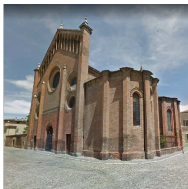
23. CHIESA SANT'AGOSTINO