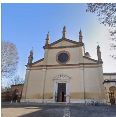
34. CHIESA DI SAN SIGISMONDO