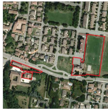
71./72./73. ORATORIO E ABITAZIONE SANTA MARIA MADDALENA