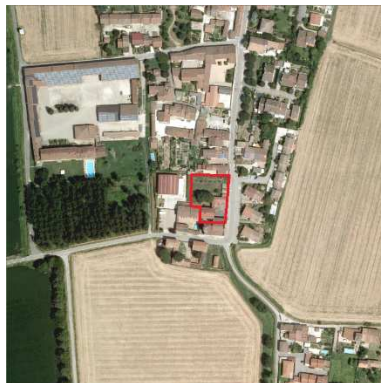
80. ORATORIO SAN SAVINO