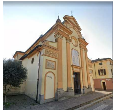
45. CHIESA SAN FELICE