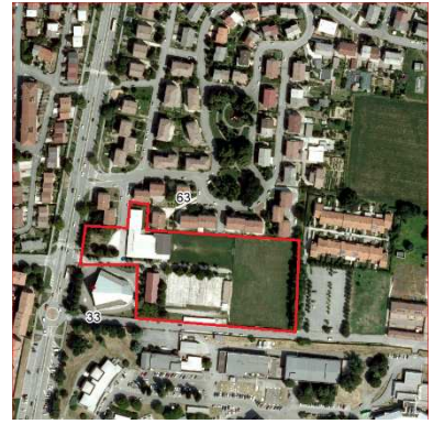
63. ORATORIO BEATA VERGINE DI CARAVAGGIO