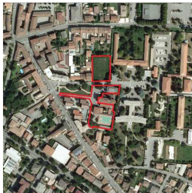
88./89. ORATORIO SAN SEBASTIANO