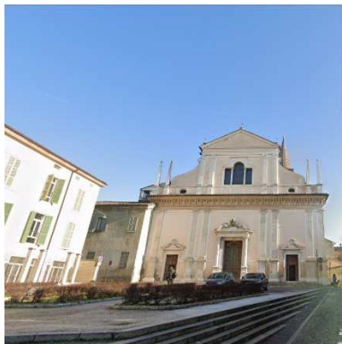
19. CHIESA SAN PIETRO