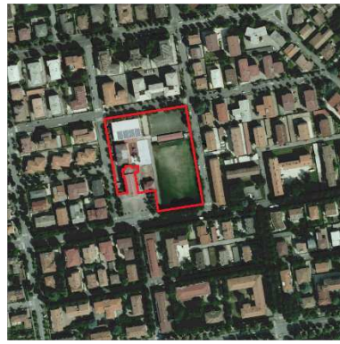
65. ORATORIO CRISTO RE