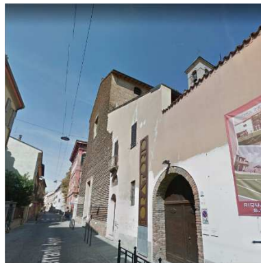
17. CHIESA SANT'IMERIO