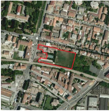
75. ORATORIO SAN BERNARDO