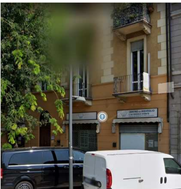
5. CHIESA DEL RISVEGLIO E DEL VANGELO VIVENTE