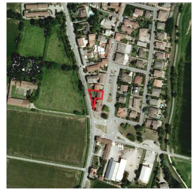
74. ABITAZIONE SANTA MARIA NASCENTE