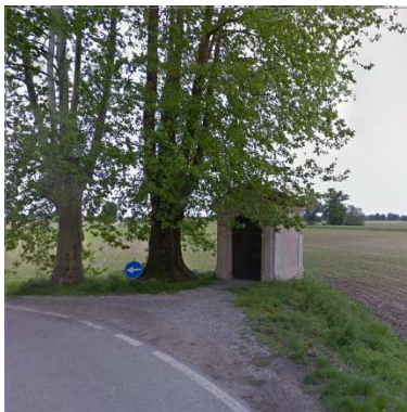
56. EDICOLA VOTIVA FARISENGO