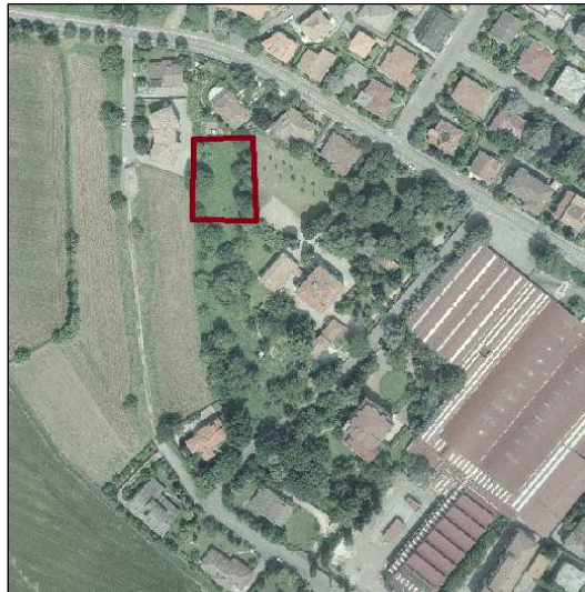
istanza n. 12.0 – Francesco Bosisio - via Flaminia