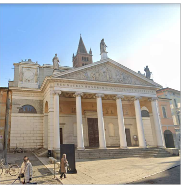
10. CHIESA SANT'AGATA