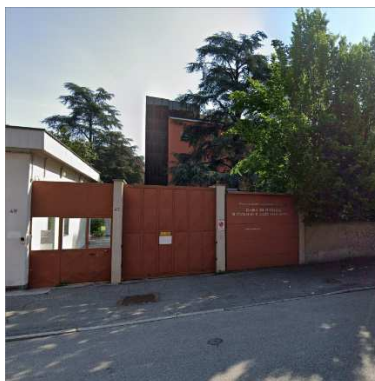
59. CAPPELLA C/O R.S.A. FONDAZIONE LA PACE