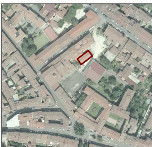
istanza n. 53.0 – Parrocchia SS. Clemente e Imerio (palazzina ex A.E.M.) - via Realdo Colombo

Riguardo a tale istanza è opportuno segnalare che con Deliberazione del Consiglio Comunale n.29 del 27 aprile 2017 era stata autorizzata “la realizzazione di un servizio pubblico o generale diverso da quanto previsto dal vigente Piano dei Servizi” come previsto dall'articolo 9, comma 15, della legge regionale n.12/2005.