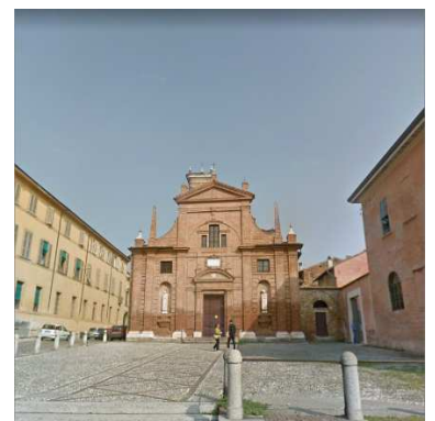
24. CHIESA SANT'OMOBONO