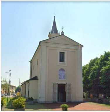
49. CHIESA SANTA MARIA ANNUNCIATA (BOSCHETTO)