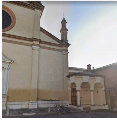
62. MONASTERO SAN GIUSEPPE (SUORE CLAUSTRALI DOMINICANE)