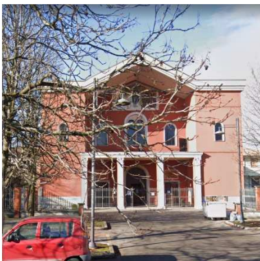
31. CHIESA BEATA VERGINE LAURETANA