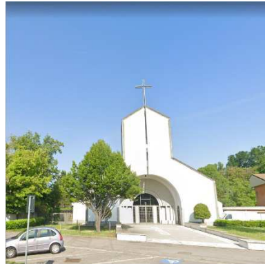
38. CHIESA SANFRANCESCO D'ASSISI