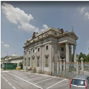
40. CAPPELLA C/O CIMITERO DI CREMONA