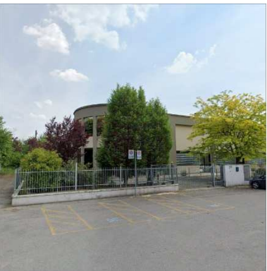
7. CONGREGAZIONE CRISTIANA DEI TESTIMONI DI GEOVA