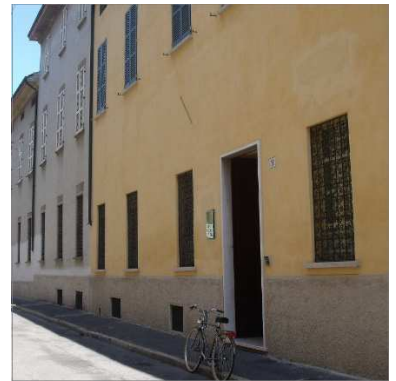
100. ISTITUTO BUON PASTORE (RESIDENZA)