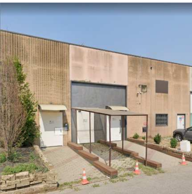
55. CENTRO ISLAMICO "LA SPERANZA" - SALA DI PREGHIERA