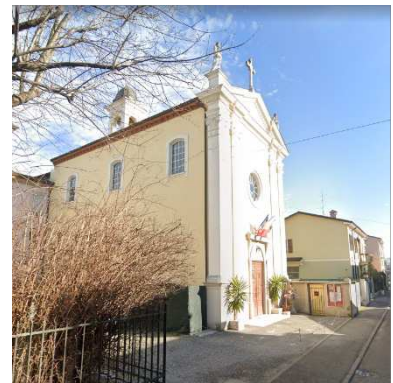
6. CHIESA ORTODOSSA ROMENA