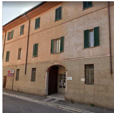
99. SUORE CARMELITANE (RESIDENZA)