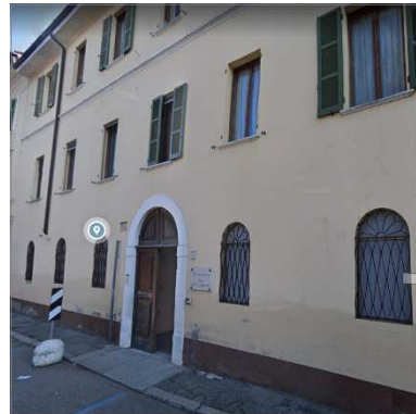
96. CASA DELL'ACCOGLIENZA (CARITAS)