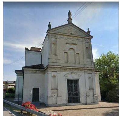
48. CHIESA SANTA MARIA NASCENTE (MIGLIARO)