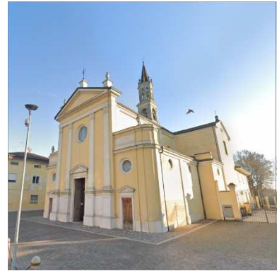
27. CHIESA SAN BERNARDO