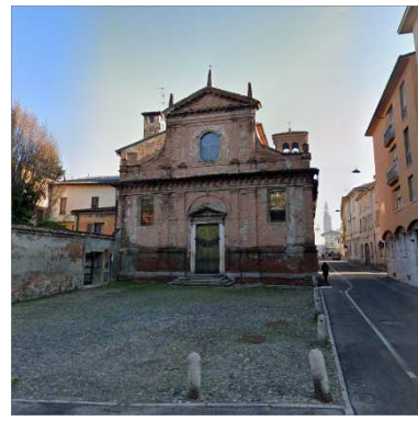
20. CHIESA SANTA LUCIA