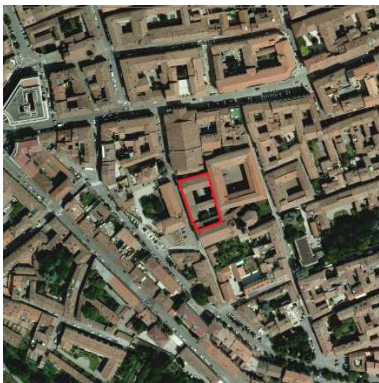
79. ORATORIO SAN PIETRO