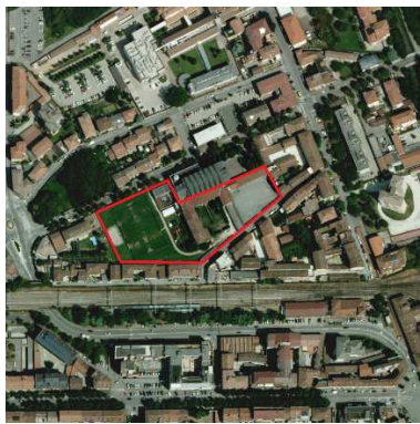
82. ORATORIO SANT'AMBROGIO