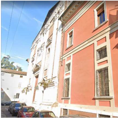
25. CHIESA SAN MARCELLINO