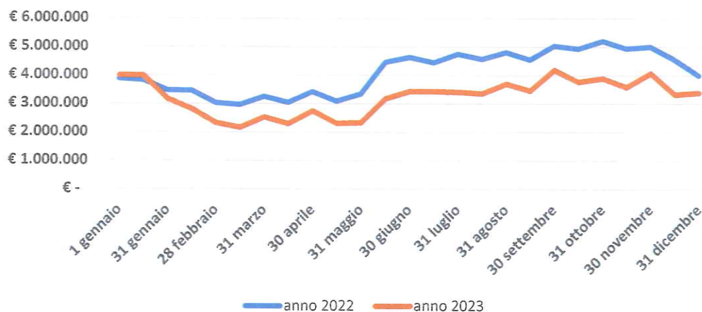
Grafico 3. Andamento saldi c/c bancario

Di seguito si riporta il grafico relativo all'andamento dei saldi dei c/c bancari accessi presso la tesoreria dell'Azienda Banca Popolare di Sondrio: