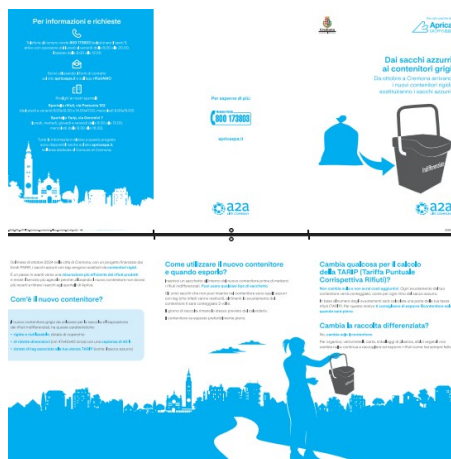
(leaflet consegnato alle utenze)