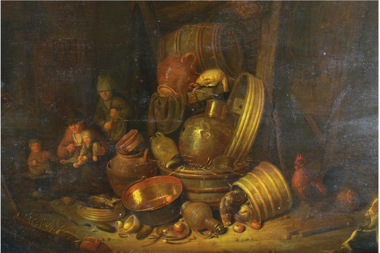
Figura 2 Dettaglio della natura morta: le tonalità dei metalli e dei colori che dovrebbero essere chiari appaiono offuscate.