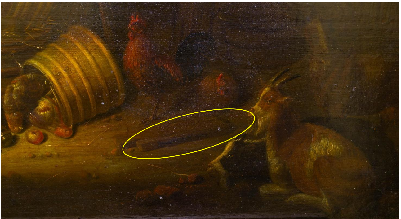
Figura 3 – Fra gli animali da cortile, sul pezzo di legno evidenziato si intravede una scritta che parrebbe essere la firma dell'autore. La stessa appare però alterata da precedenti interventi