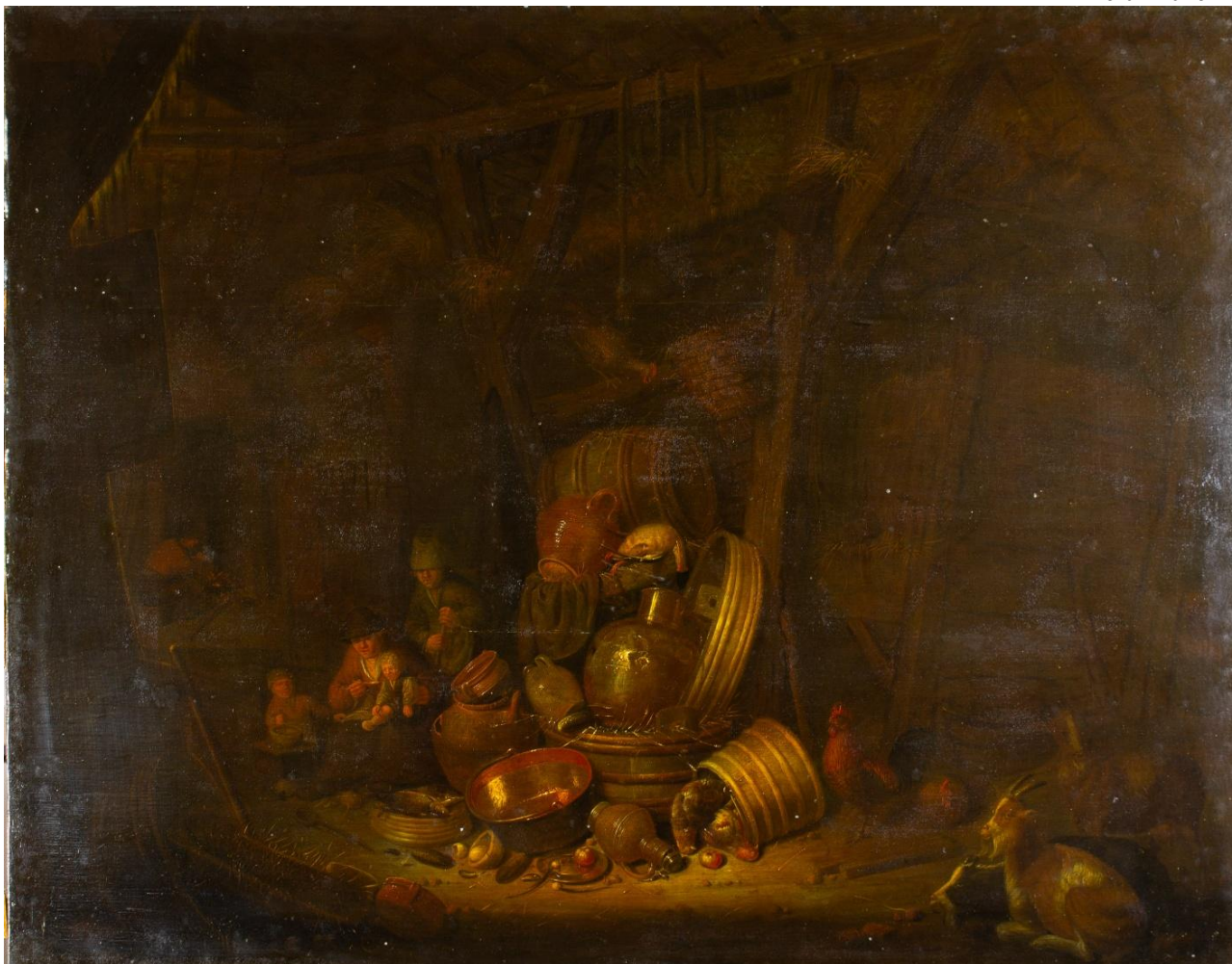
Figura 1 Totale dell'opera: la superficie generale appare ingiallita a causa della sovrapposizione di svariati strati di vernice stesi in precedenti interventi di restauro o manutenzione.