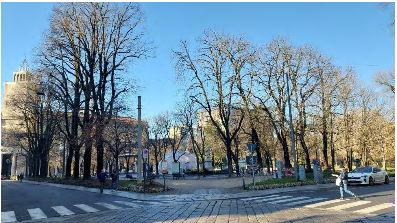
4- Giardini Papa Giovanni Paolo II – veduta angolo Sud-Est, accesso n.3