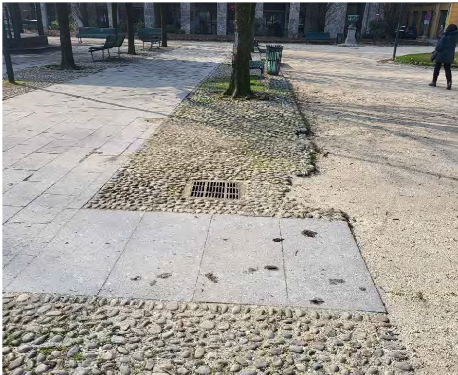
27 – Giardini Papa Giovanni Paolo II – pavimentazione in pietra con fasce di acciottolato della zona meridionale