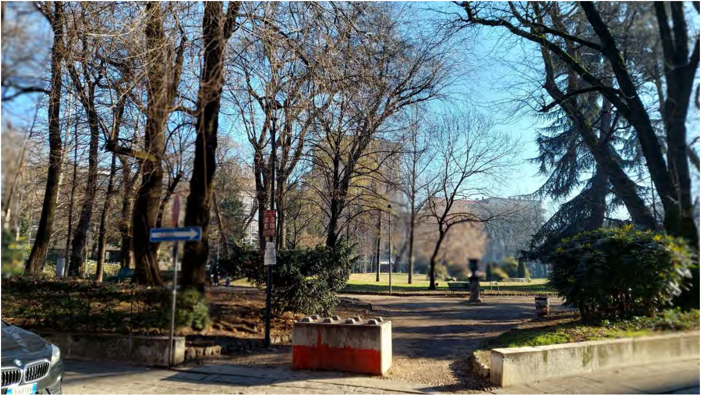
12- Giardini Papa Giovanni Paolo II – particolare accesso nord-occidentale, n.7