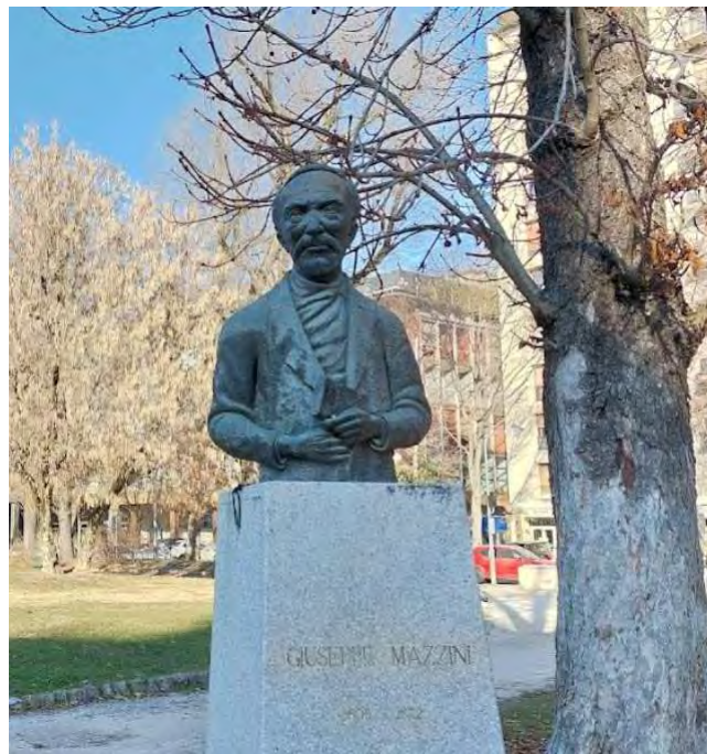
26- Giardini Papa Giovanni Paolo II – busto bronzeo dedicato a Giuseppe Mazzini