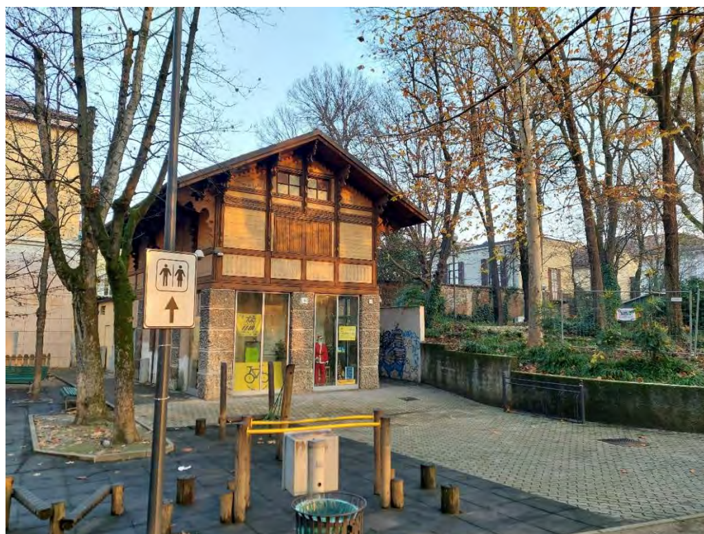
15- Giardini Papa Giovanni Paolo II – particolare zona nord-occidentale – edificio denominato “chalet” o “casa del Custode” e parco giochi