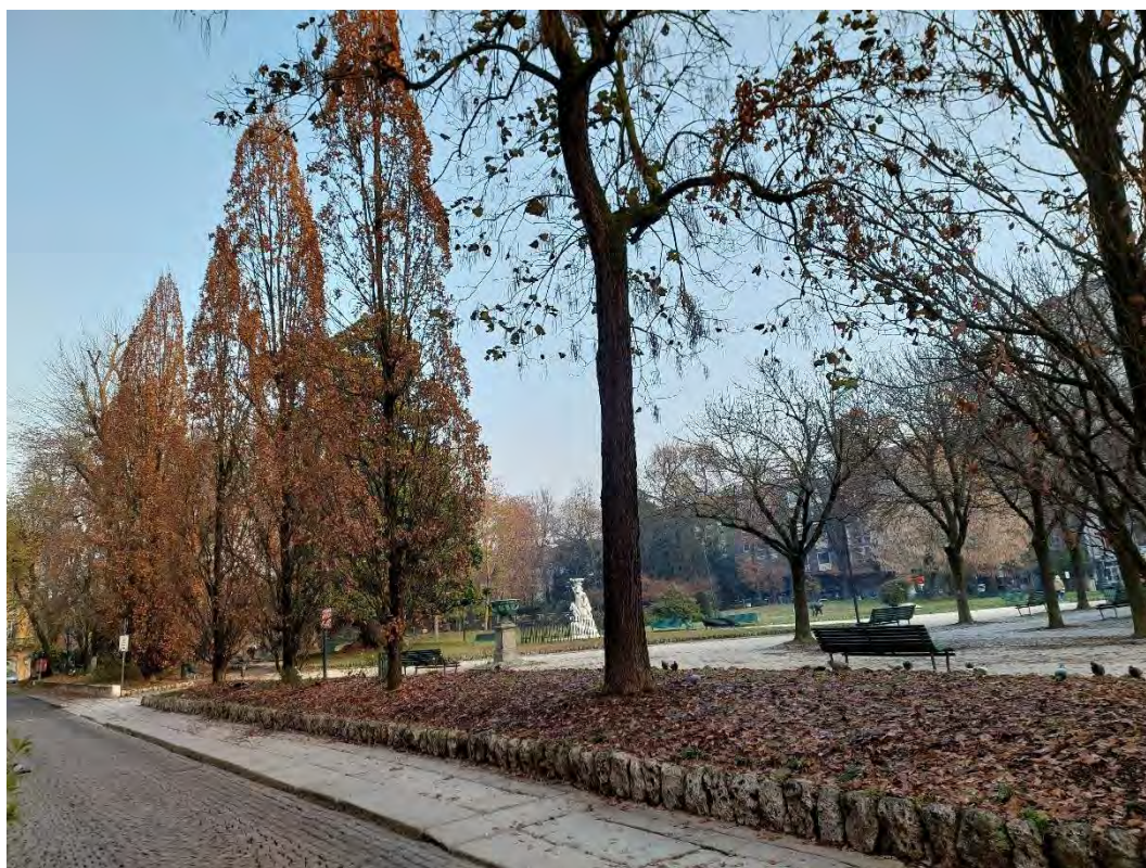
10- Giardini Papa Giovanni Paolo II – veduta perimetro occidentale, verso Nord