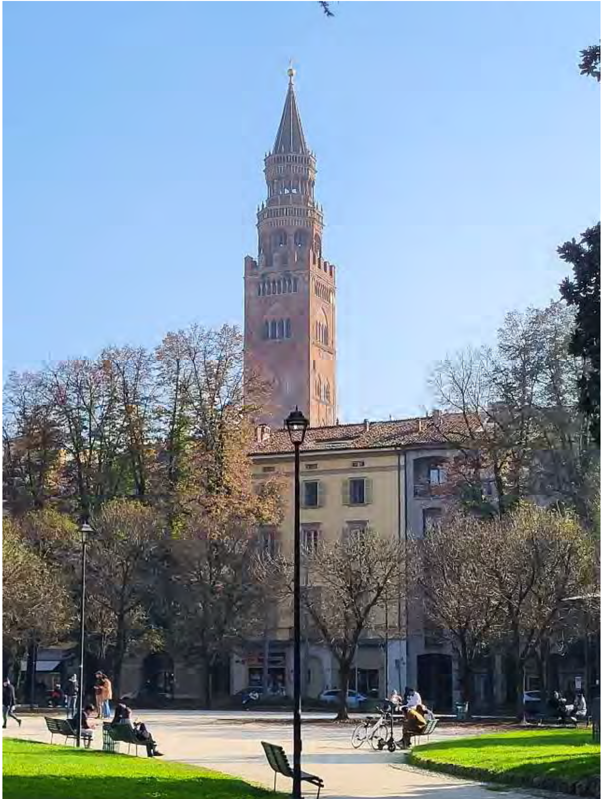
20- Giardini Papa Giovanni Paolo II – particolare del percorso interno intorno alla grande aiuola centrale, verso Sud Est, con veduta sul “Torrazzo”