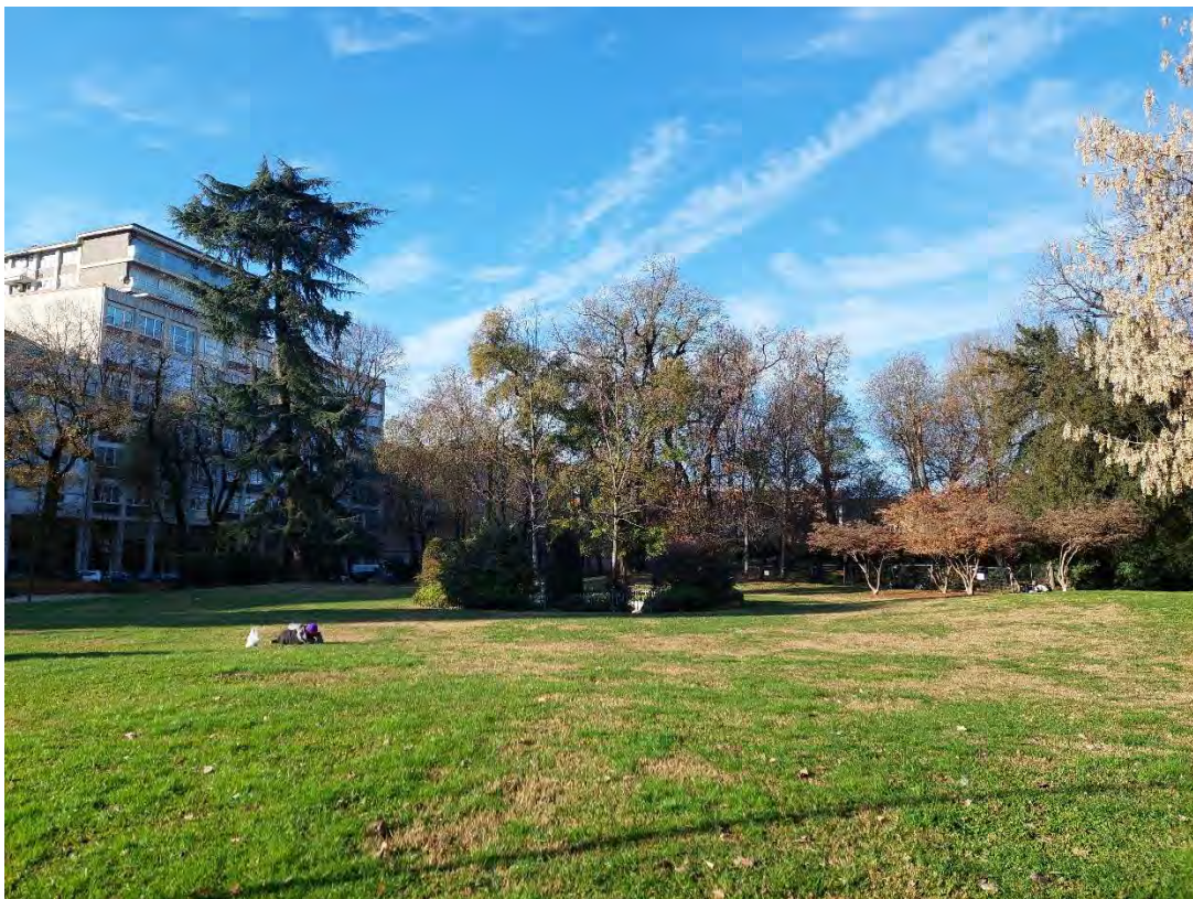
19- Giardini Papa Giovanni Paolo II – Fontana Centrale