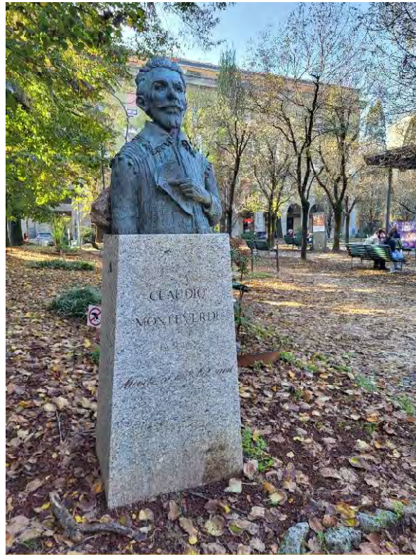
25- Giardini Papa Giovanni Paolo II – busto bronzeo dedicato a Claudio Monteverdi