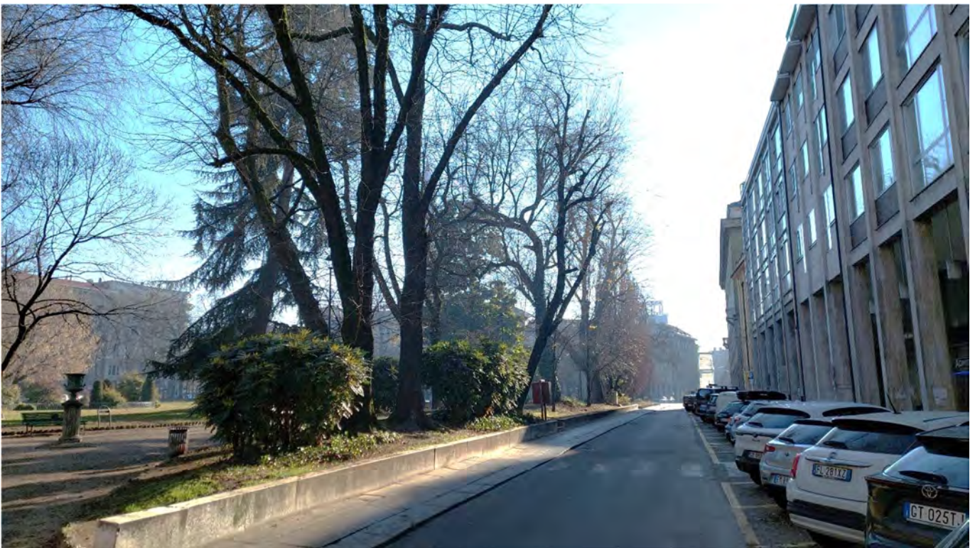
13- Giardini Papa Giovanni Paolo II – veduta del perimetro occidentale, verso Sud