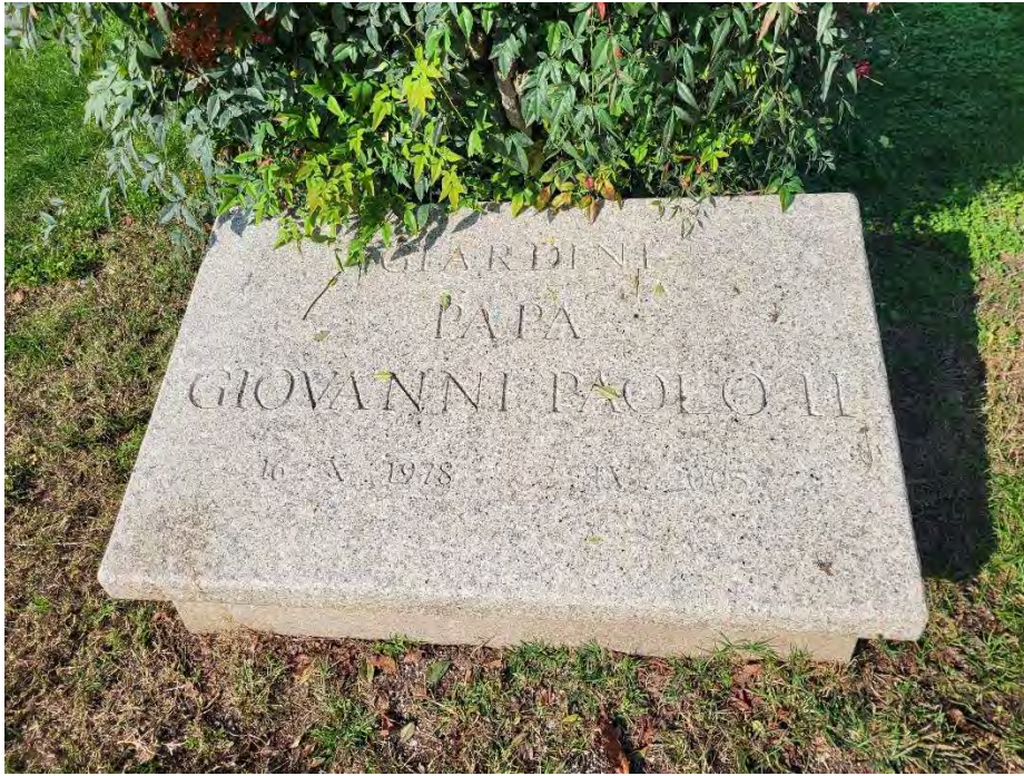
27- Giardini Papa Giovanni Paolo II – lastra dedica dei giardini a Papa Giovanni Paolo II