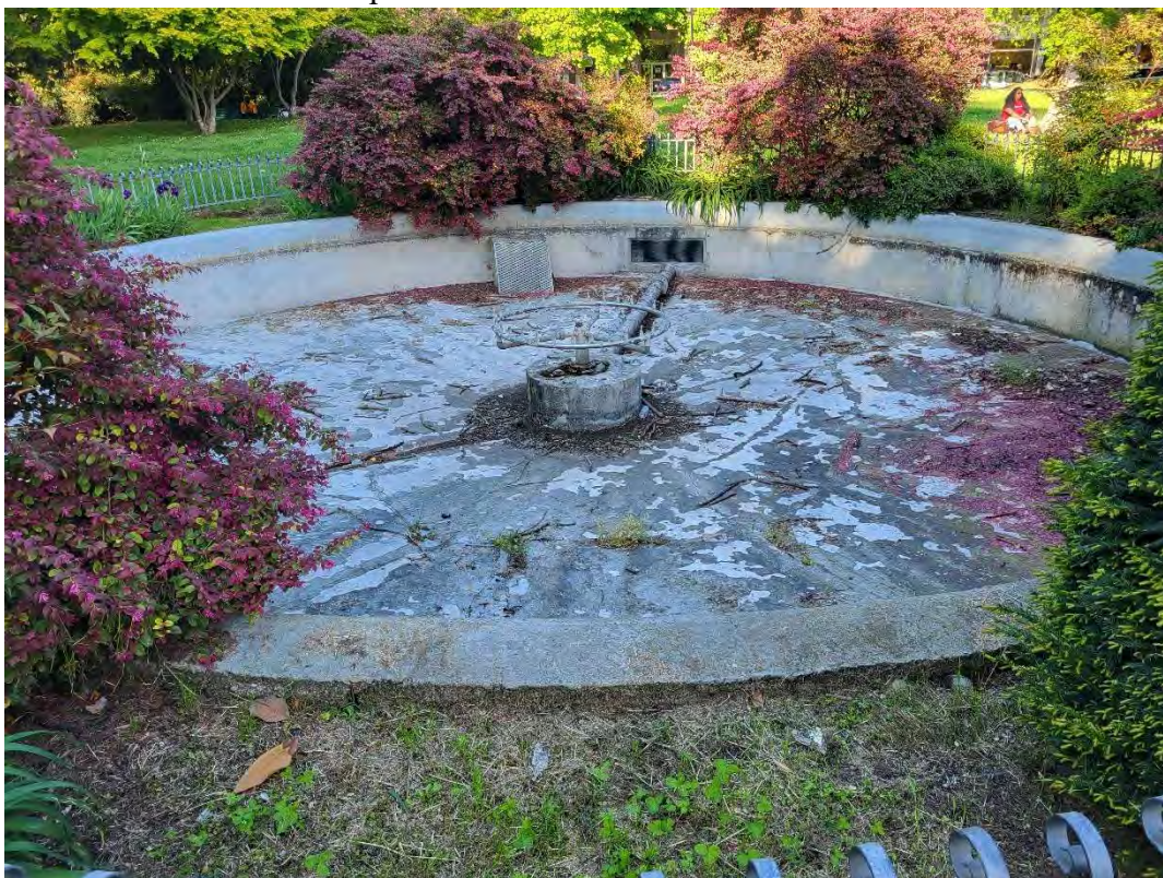
24- Giardini Papa Giovanni Paolo II – fontana centrale