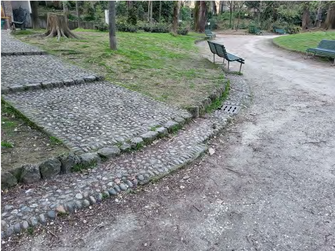
28 – Giardini Papa Giovanni Paolo II – pavimentazione in acciottolato e cordoli in Ceppo d’Iseo, zona NO