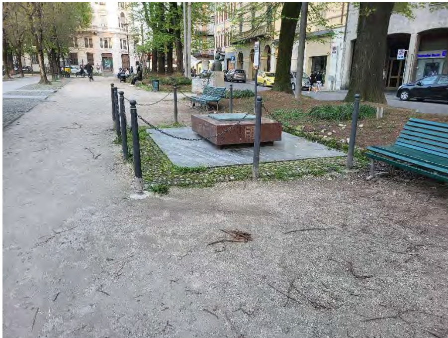
28- Giardini Papa Giovanni Paolo II – Monumento dedicato a Stradivari