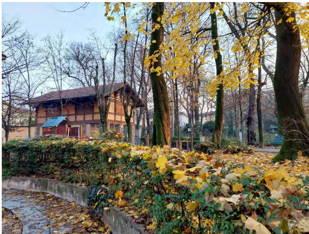
14- Giardini Papa Giovanni Paolo II – particolare zona nord-occidentale – edificio denominato “chalet” o “casa del custode”