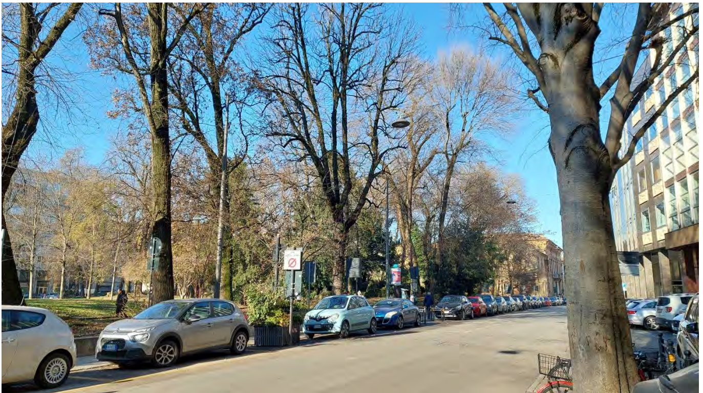
9- Giardini Papa Giovanni Paolo II – veduta porzione Est