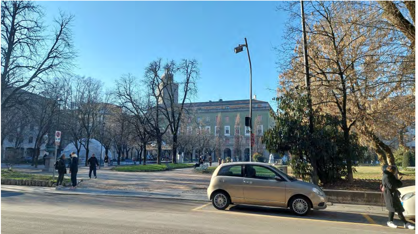
3- Giardini Papa Giovanni Paolo II – particolare accesso n.2 orientale a E,