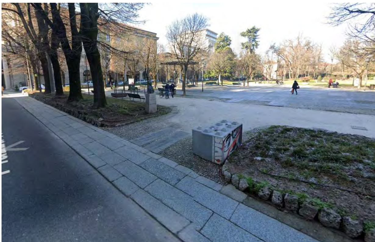
5- Giardini Papa Giovanni Paolo II – veduta Sud, accesso n.4