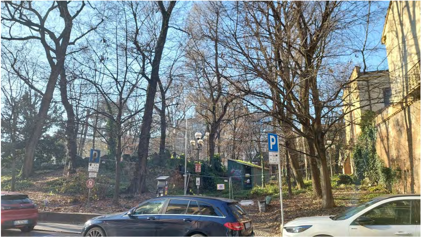
1- Giardini Papa Giovanni Paolo II – particolare accesso orientale a NE, n.1, zona rocaille