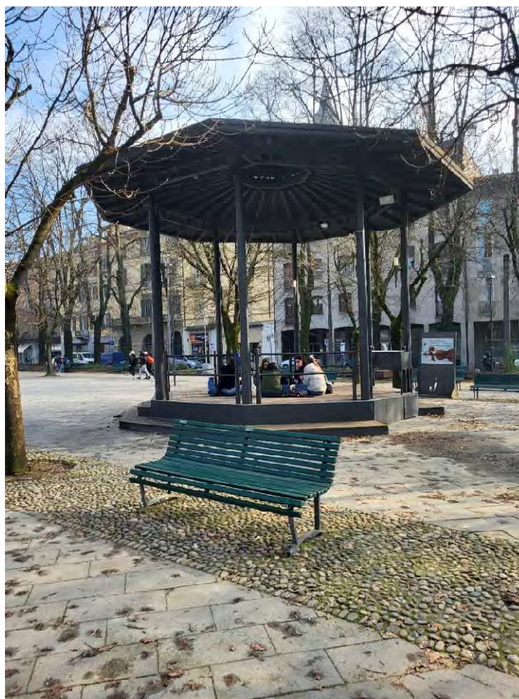
25 – Giardini Papa Giovanni Paolo II – gazebo ottagonale installato negli anni Ottanta del secolo scorso