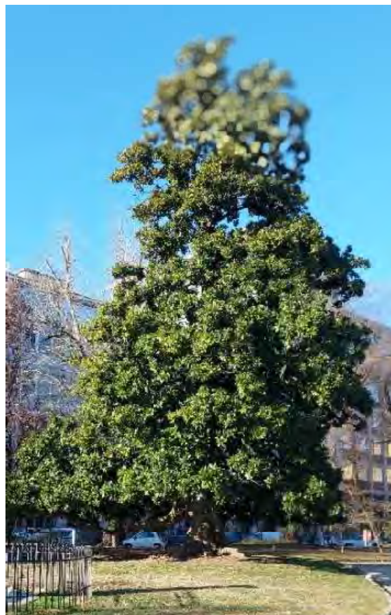
22- Giardini Papa Giovanni Paolo II – la grande magnolia storica