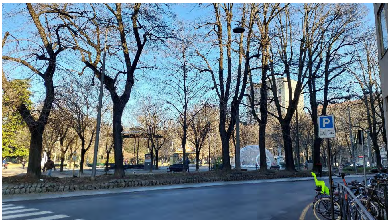
7- Giardini Papa Giovanni Paolo II – veduta porzione Sud