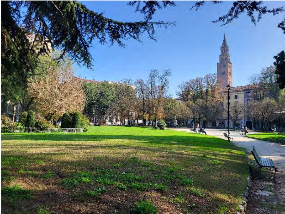
18- Giardini Papa Giovanni Paolo II – percorso interno intorno alla grande aiuola centrale, verso Sud Est, con veduta sul “Torrazzo”