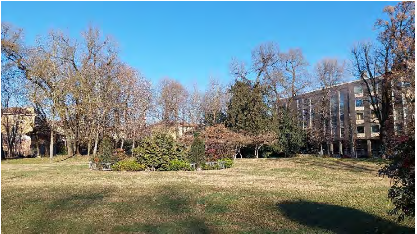
16- Giardini Papa Giovanni Paolo II – grande aiuola ellittica centrale e fontana principale, attualmente dismessa