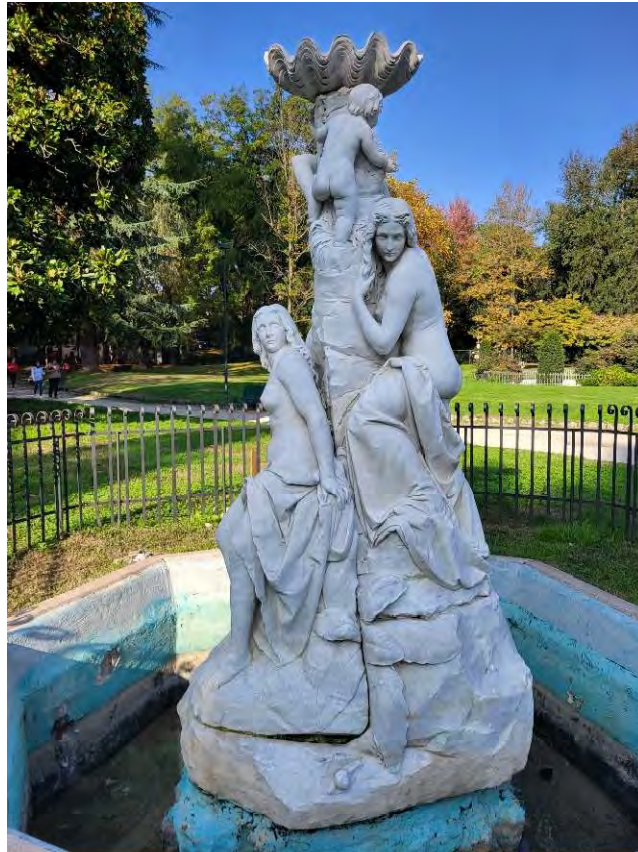
23- Giardini Papa Giovanni Paolo II – fontana delle Naiadi