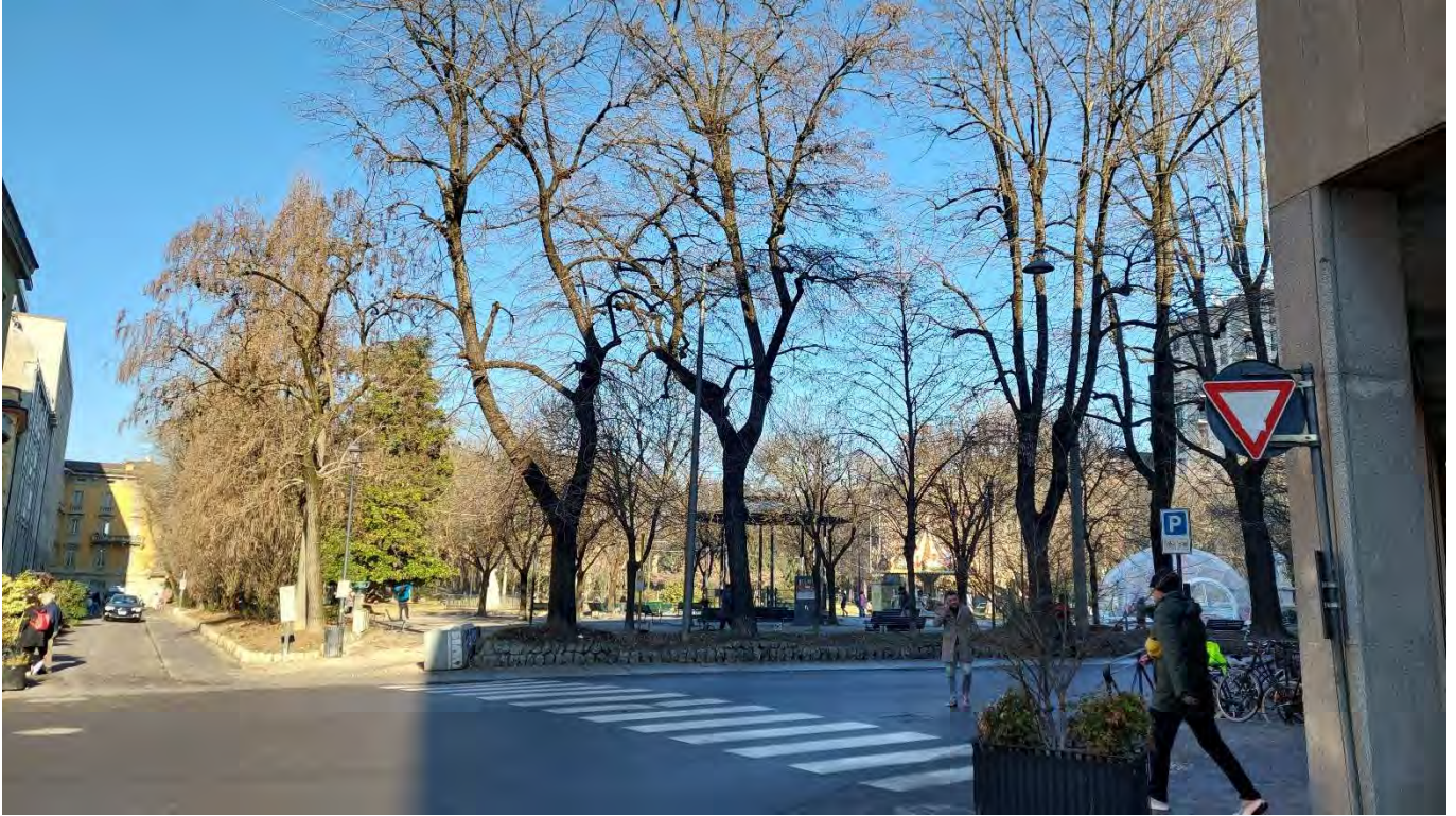
8- Giardini Papa Giovanni Paolo II – veduta accesso dall'angolo Sud-Ovest, n.5