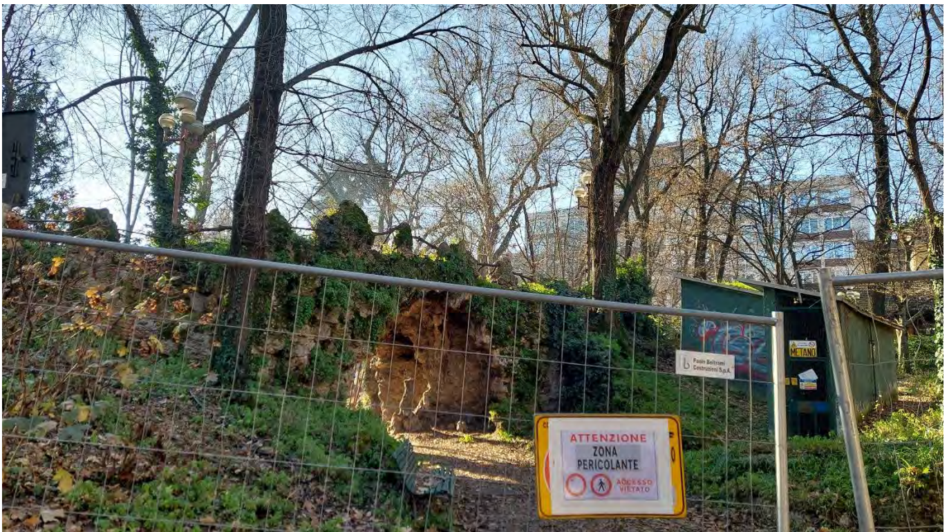
2- Giardini Papa Giovanni Paolo II – particolare accesso orientale a NE, n.1, zona rocaille