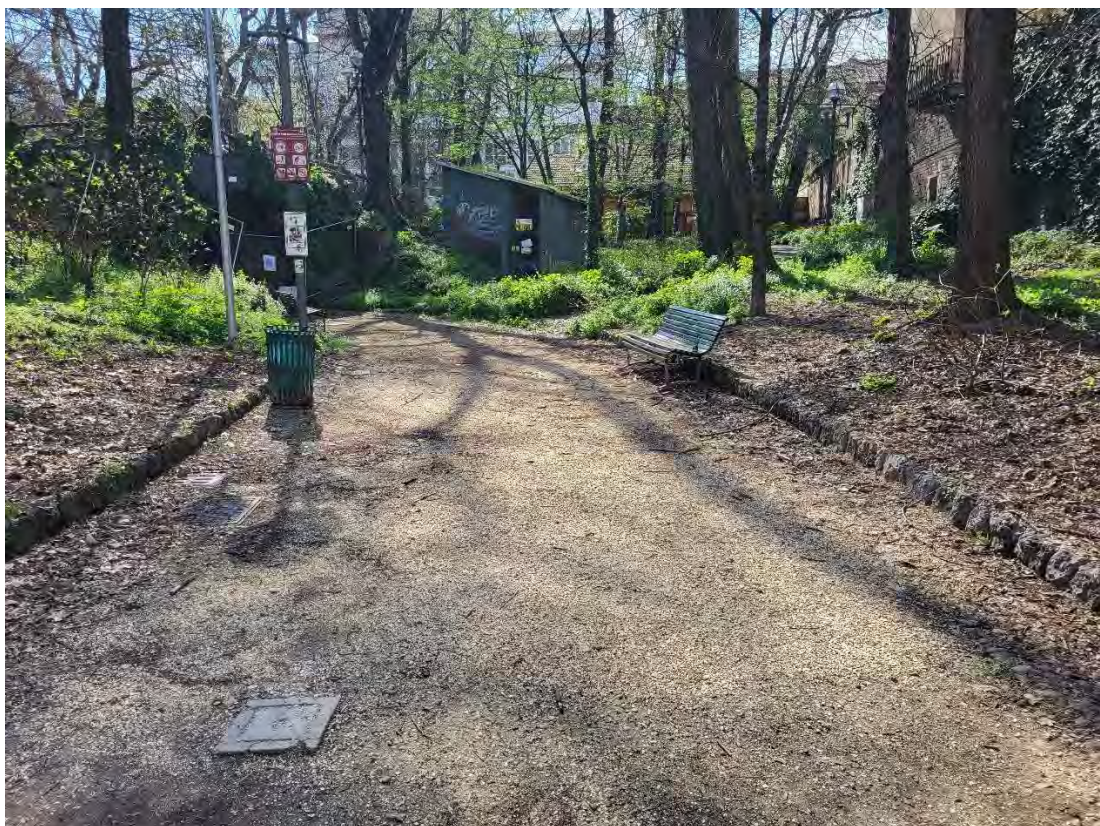
29 – Giardini Papa Giovanni Paolo II – pavimentazione in calcestre, con bordature laterali in acciottolato e cordoli in Ceppo d’Iseo; zona rocaille, nei pressi dell’accesso n.1; sullo sfondo la cabina del Gas Metano