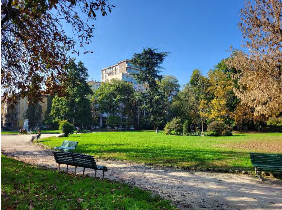
17- Giardini Papa Giovanni Paolo II – percorso interno intorno alla grande aiuola centrale, verso Sud Ovest