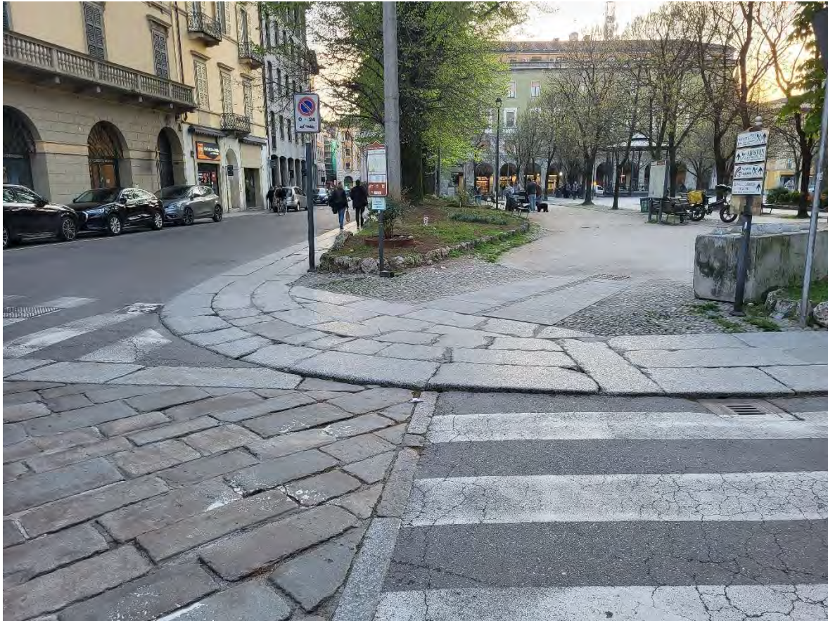
31 – Giardini Papa Giovanni Paolo II – pavimentazione in pietra in corrispondenza dell'accesso n.5