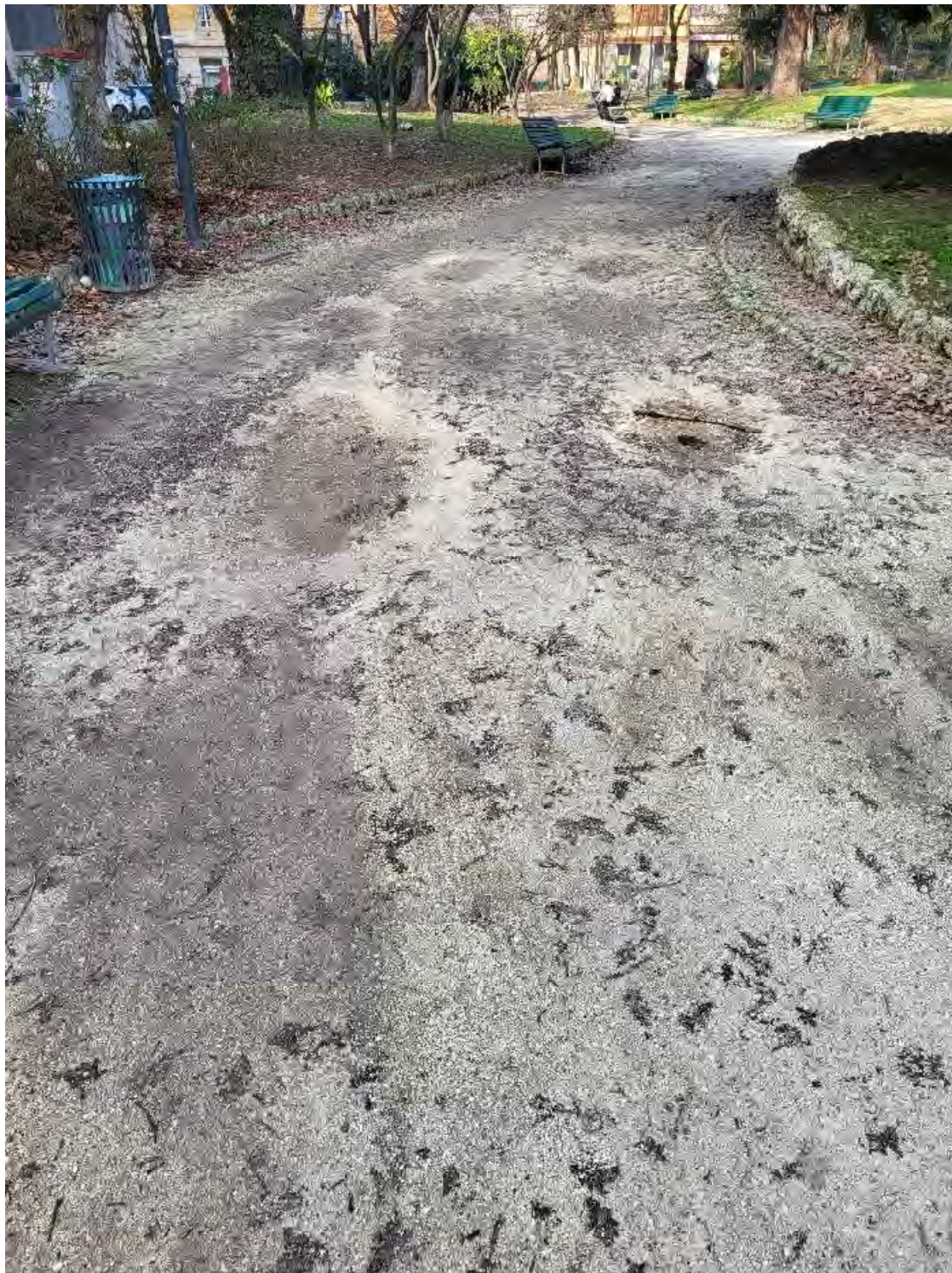
30 – Giardini Papa Giovanni Paolo II – pavimentazione in calcestre, gravemente danneggiata da avvallamenti e perdita del materiale fine superficiale, zona centrale