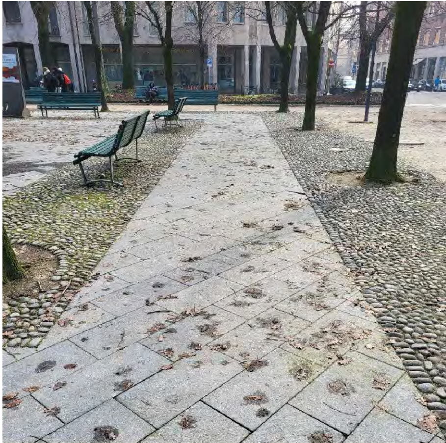
26 – Giardini Papa Giovanni Paolo II – pavimentazione in pietra con fasce di acciottolato della zona meridionale