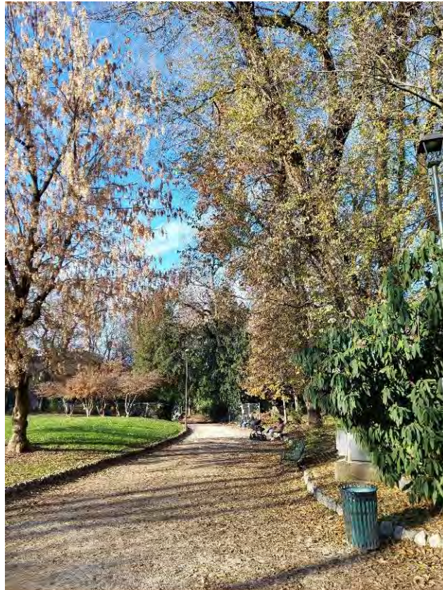
21- Giardini Papa Giovanni Paolo II – particolare del percorso interno intorno alla grande aiuola centrale, verso Nord Est in direzione della zona rocaille