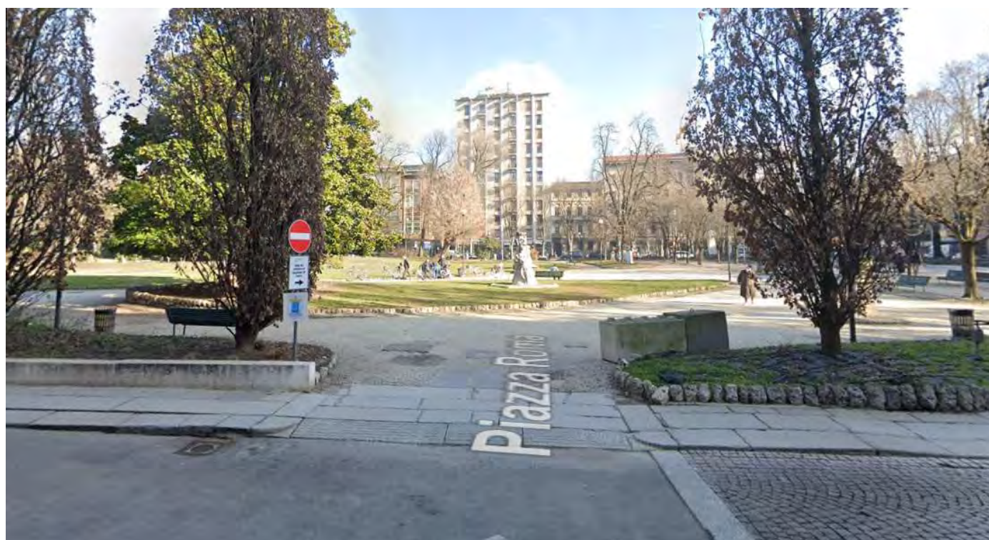
11- Giardini Papa Giovanni Paolo II – particolare accesso occidentale, n.6