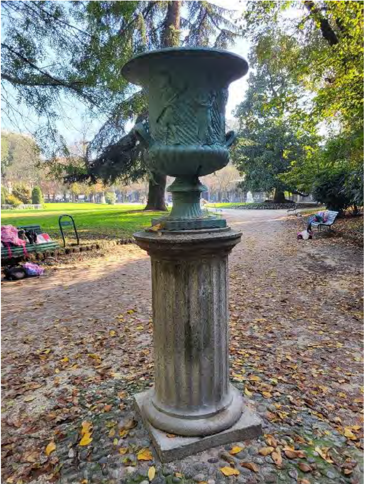
30- Giardini Papa Giovanni Paolo II – uno dei tre vasi in ghisa classicheggianti, acquistati a Parigi intorno al 1878; zona Nord Ovest, vicino all'accesso n.7